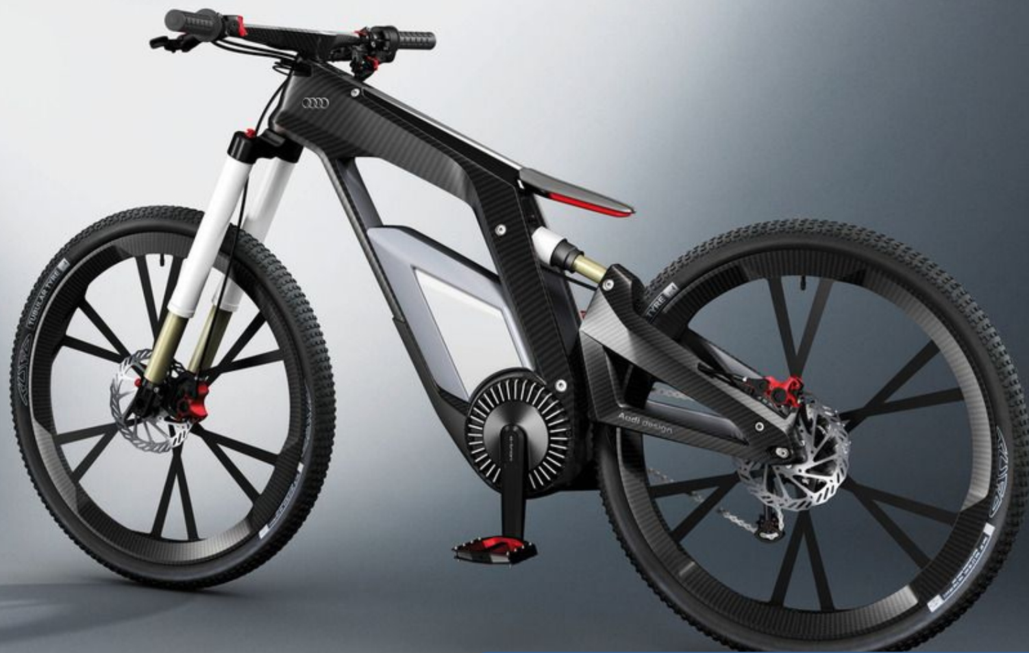
Электрический велосипед Audi