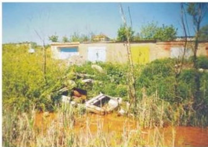
Огороды и сопутствующие им свалки в прибрежной полосе реки Дон

Сегодня на всем своем протяжении река Дон на испытывает мощную антропогенную нагрузку.