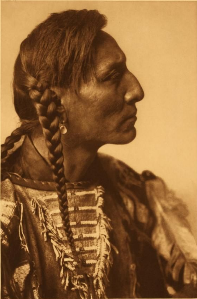
SPOTTED BULL - MANDAN

Апачи – кочевое племя, селившееся в Рио-Гранде, а затем переселившееся на юг, в Техас и Мексику. Основным занятием была охота на буйвола, который стал символом племени (тотемом).