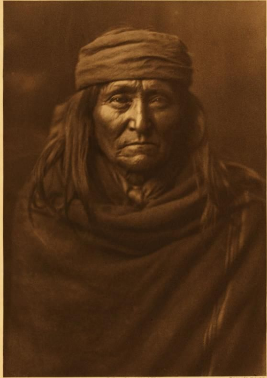
BARRE - ARIZONA