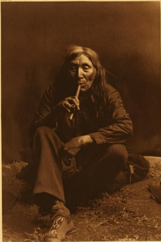
CHW NAILS - SPIGAN