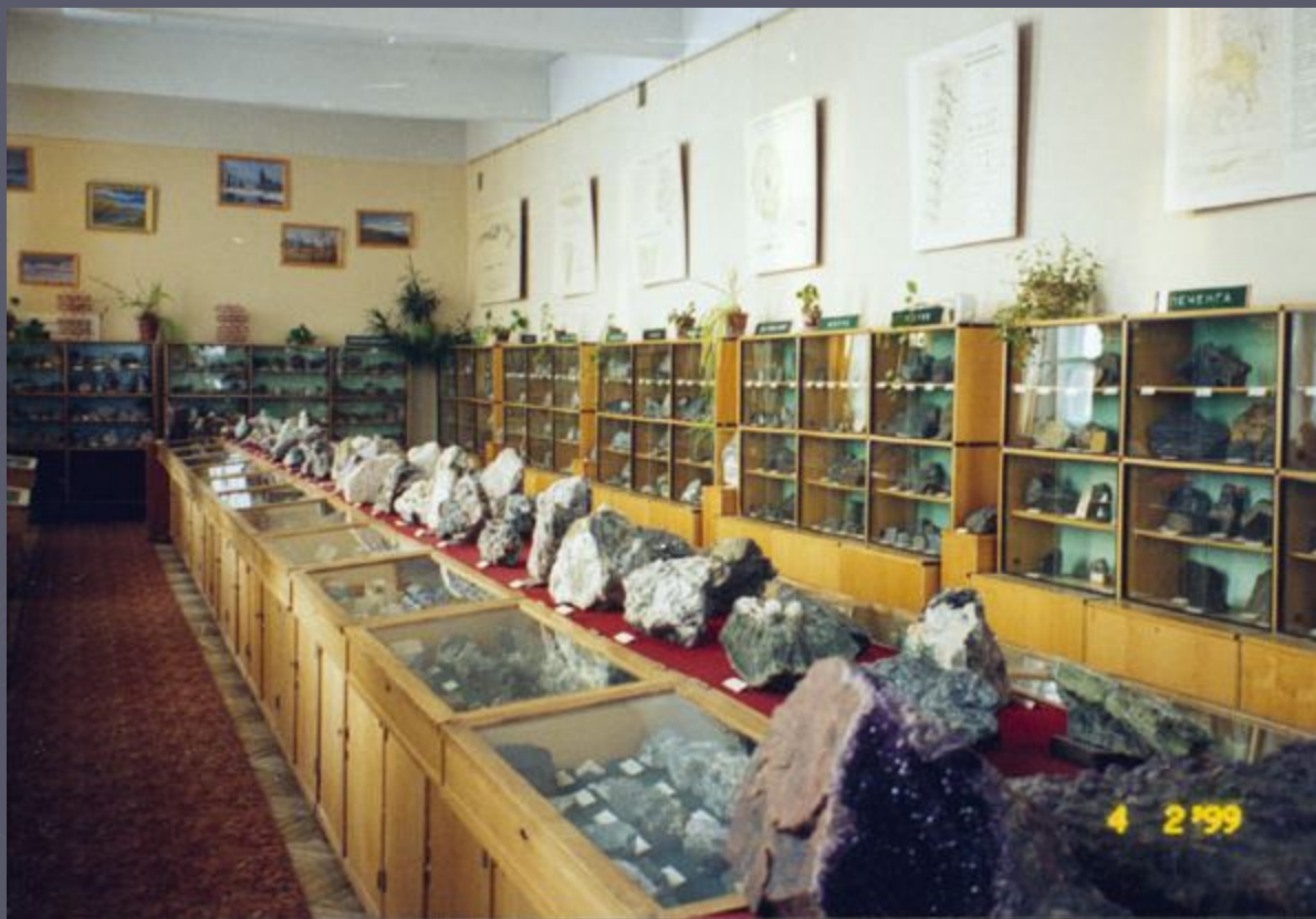
Минералогический музей геологического института Кольского научного центра РАН