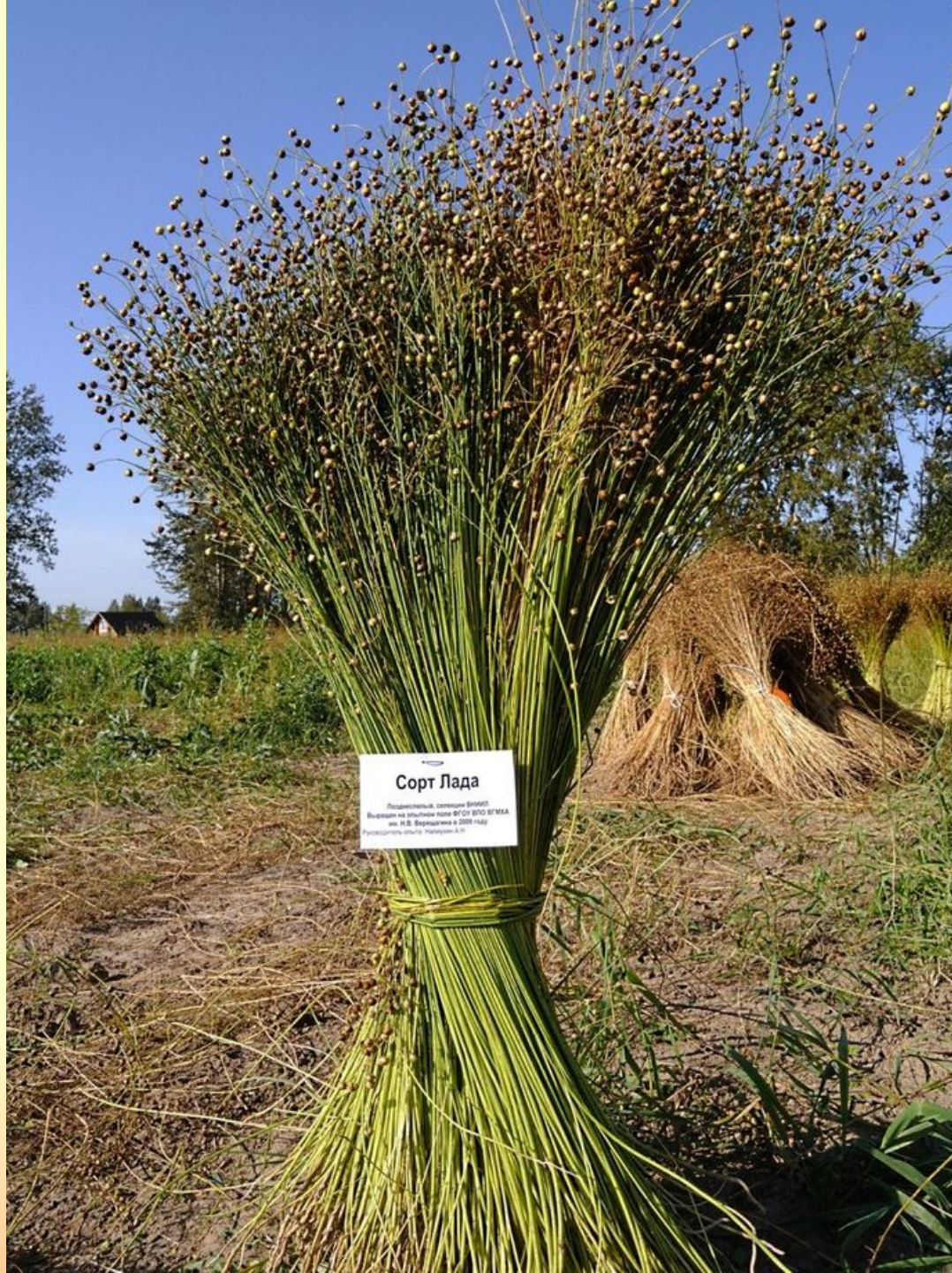
Сорт Лада Полувисокий, семена 010007 Выявлен на опытной посеи ФГОУ ВПО ВГМУА им. Н.Д. Бердяева в 2009 году Регистрация селек. материала отсутствует