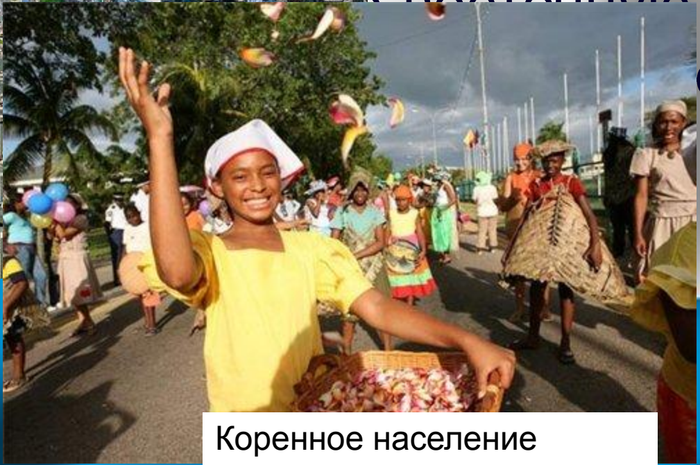
Коренное население Аргентины - креолы