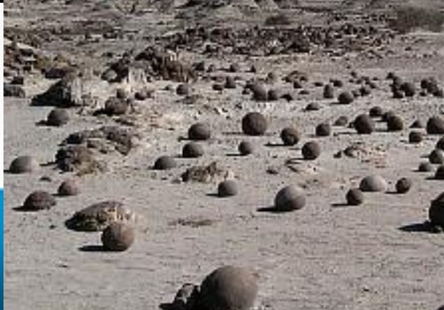
Множество шарообразных камней в национальном парке Исчигуаласто