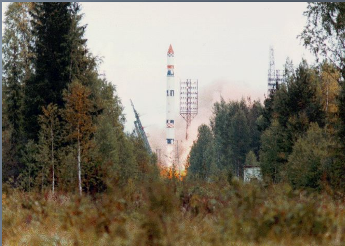
Запуск ракеты Циклон-3 с космодрома Плесецк