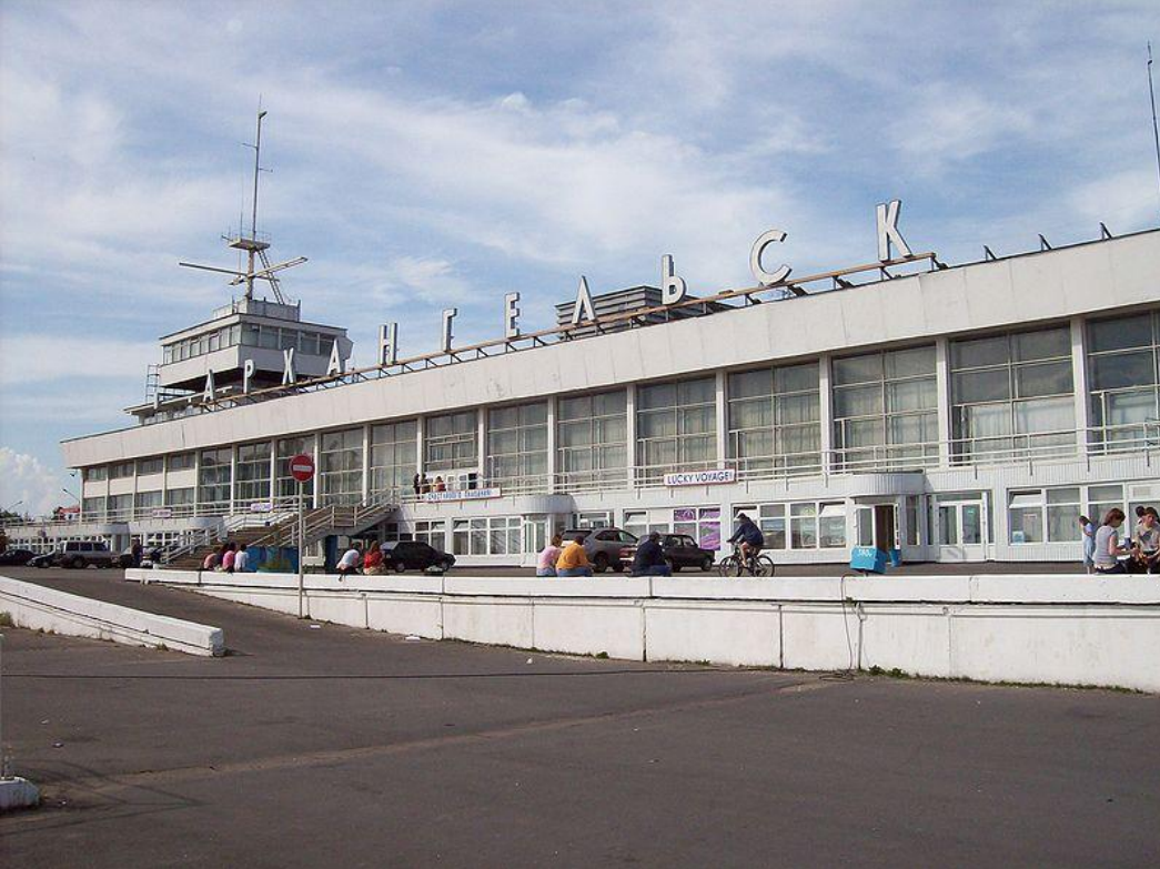
Морской – речной вокзал в центре Архангельска