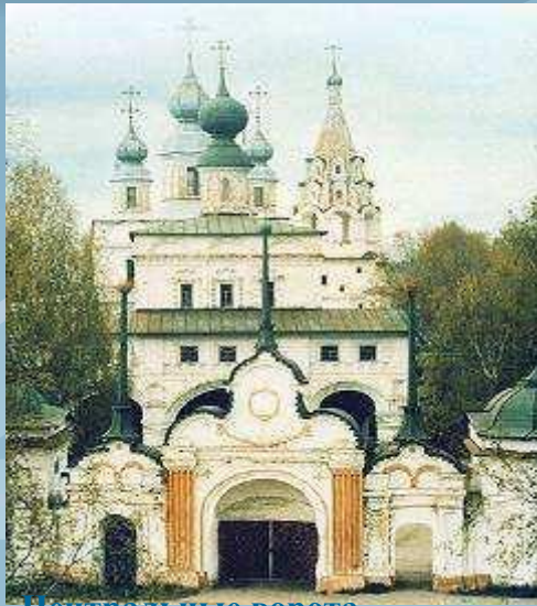
Центральные ворота Михайло-Архангельского монастыря