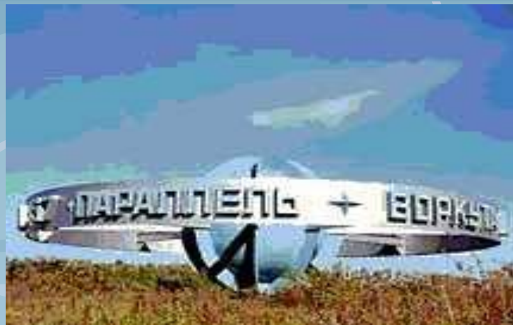
Воркута. 67 параллель