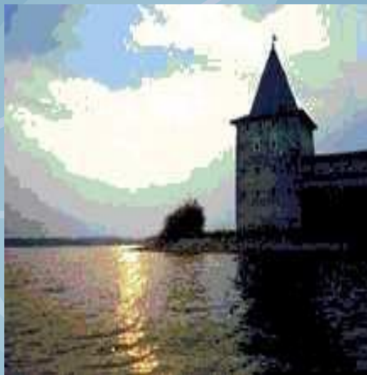
Кирилло-Белозерский монастырь. Свечечная башня