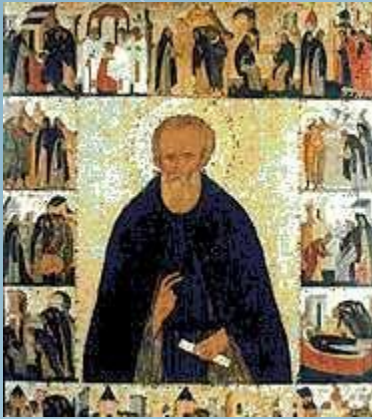
Дионисий. Деяния Дмитрия Прилуцкого. Икона из Спасо- Прилуцкого монастыря

С Вологодским краем связаны жизнь преподобного Дмитрия Прилуцкого, поэта К. Н. Батюшкова (уроженец), писателя В. А. Гиляровского, художника В. В. Верещагина (уроженец), ученого и изобретателя А. Ф. Можайского, писателя В. И. Белова, физика Г. С. Ландсберга (уроженец), писателя В. Т. Шаламова (уроженец). Область — один из центров русского фольклора.