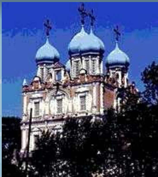
Собор Введенского монастыря в Сольвычегодске.