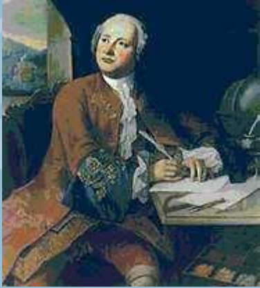
М. В. Ломоносов

Архангельская область — родина ученого М. В. Ломоносова и скульптора Ф. В. Шубина (уроженцы Холмогор), писателя Ф. А. Абрамова (деревня Веркола). В селе Суре Пинежского района родился святитель Иоанн Кронштадский. С Поморьем связано творчество художника В. В. Верещагина, писателей М. М. Пришвина и Ю. П. Казакова. Сказовая речь поморов запечатлена в произведениях Б. В. Шергина.