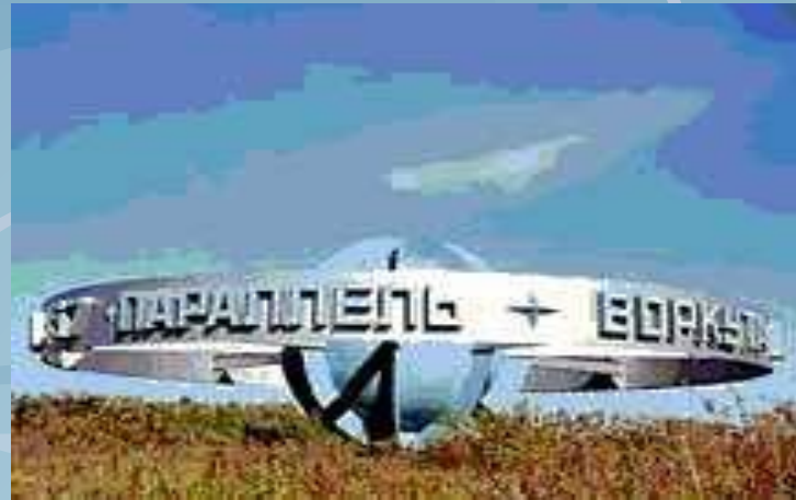
Воркута. 67 параллель