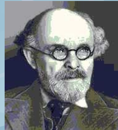
М. М. Пришвин