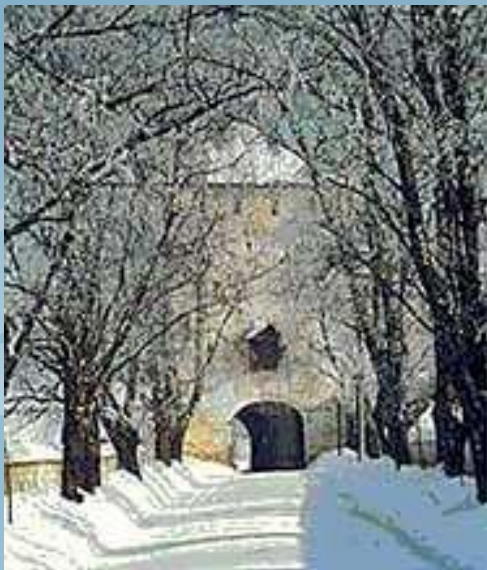
Кириллов. Алея нового города