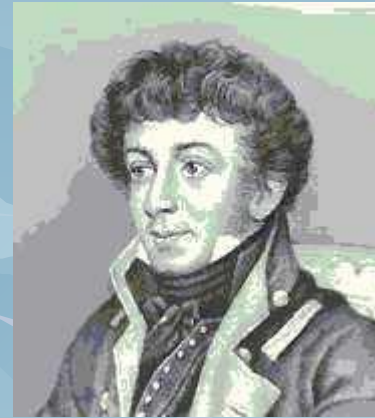
К. Н. Батюшков