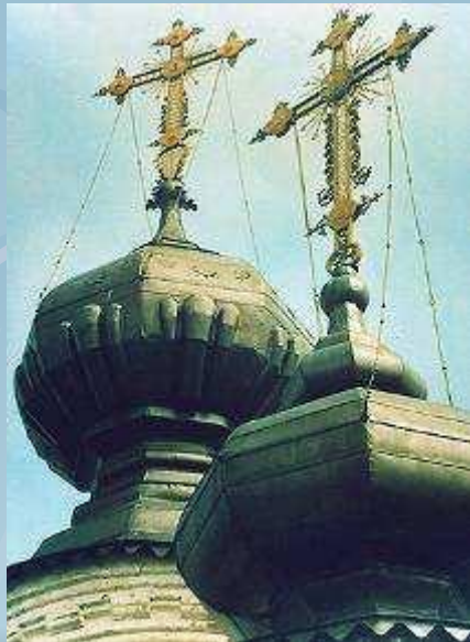
Кресты Вознесенской церкви