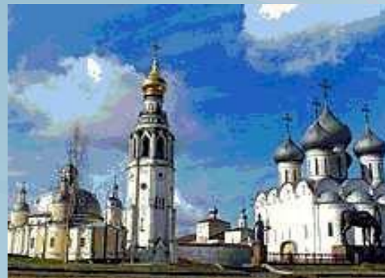
Вологда. Спасо-Прилуцкий монастырь