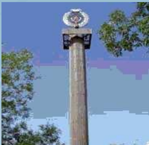
Воркута. Стела шахтерской славы