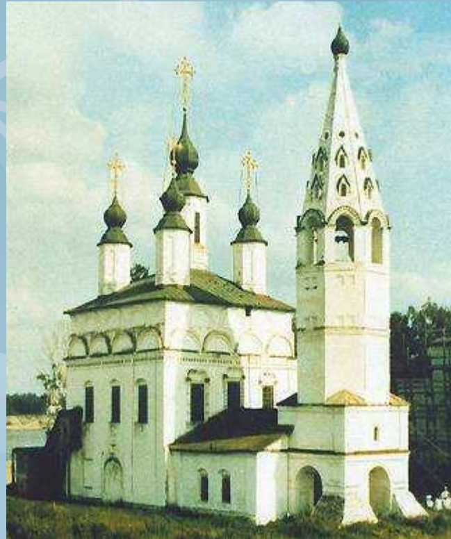
Церковь Дмитрия Солунского