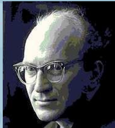
Ю. П. Казаков