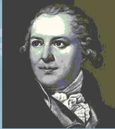
Ф. В. Шубин