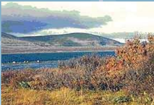
Вид на реку Пинегу