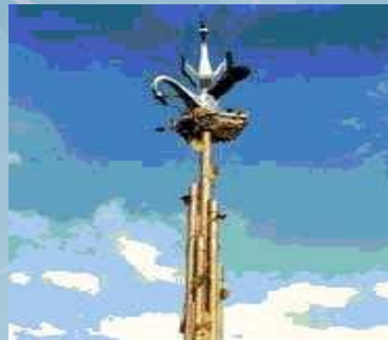
Воркута. Монумент Победы.