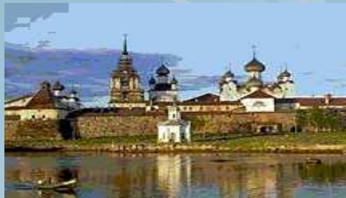
Ансамбль Соловецкого монастыря