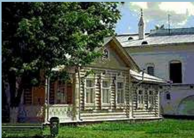
Вологда. Пряничный домик