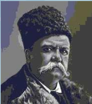
В. А. Гиляровский