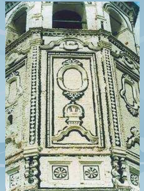
Колокольня церкви Николы Гостинного