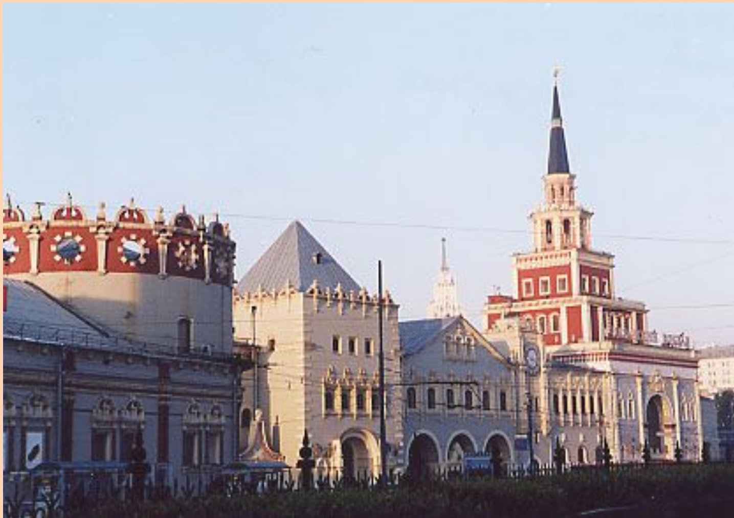
современный Казанский вокзал