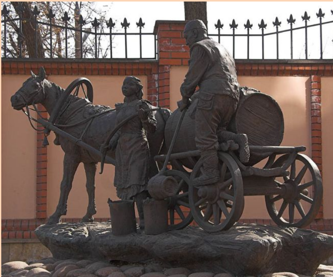
ул.Горького памятник казанскому водовозу