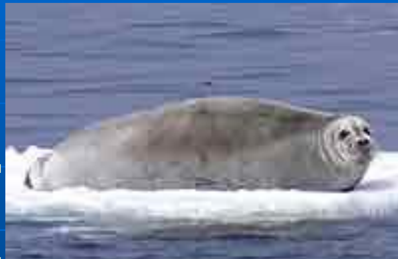
Морской заяц Морской заяц