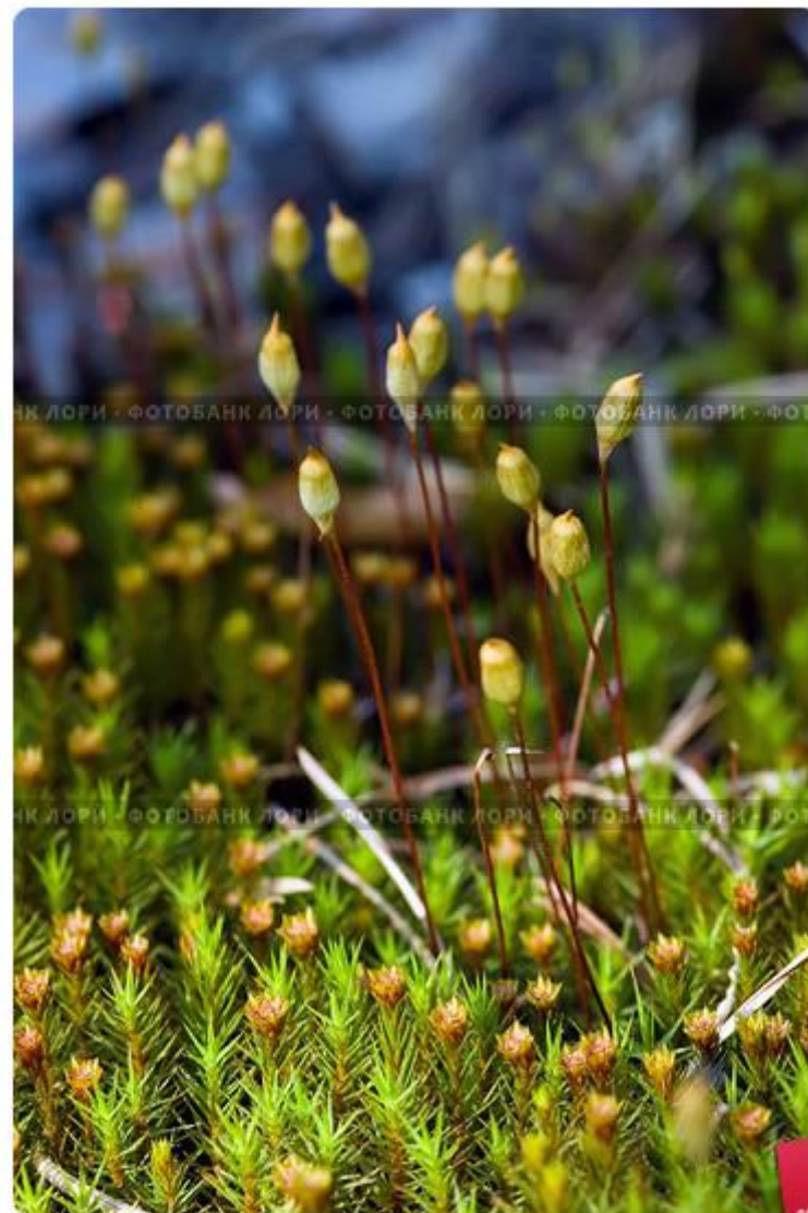
Зеленый мох