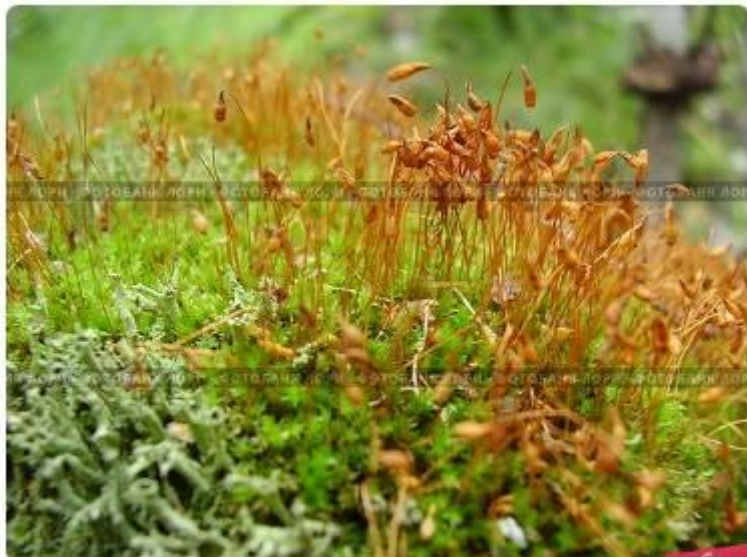
Кукушкин лен