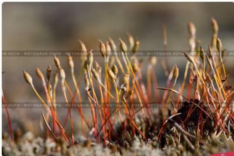
Северный мох