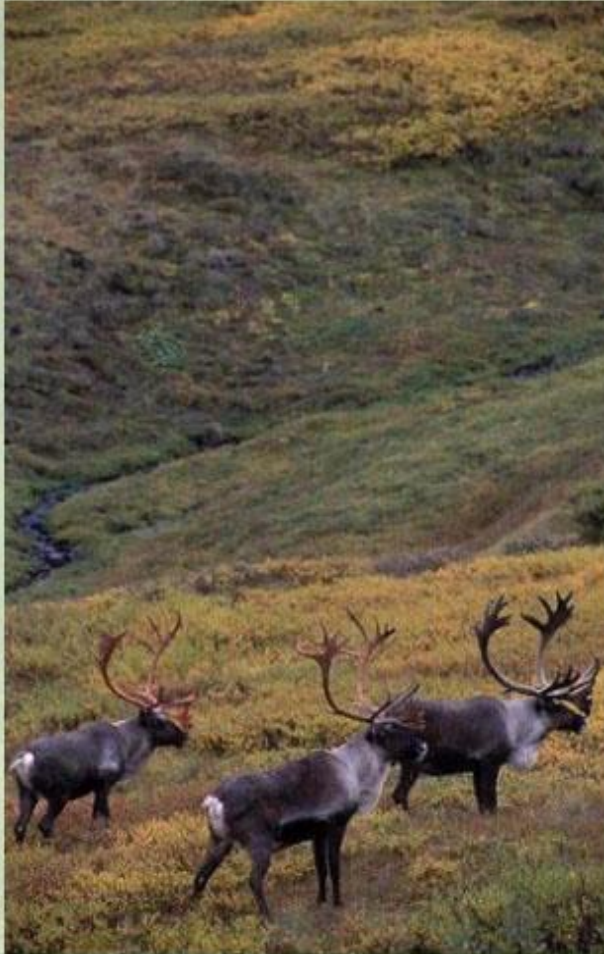
Карибу - американский северный олень.

В настоящее время воздействие человека стало поистине опустошающим: за первые тридцать лет XX в. численность карибу в Северной Америке сократилась с 3 млн. до 200 тыс. голов! Теперь охота на оленей ограничена законами США и Канады. В Северной Сибири оказался на грани исчезновения ценный пушной зверь - соболь, которого удалось спасти, только взяв под охрану закона.