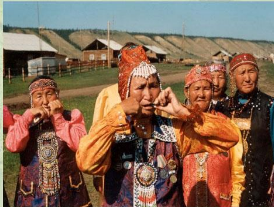
Национальный инструмент народов Севера - хомус.