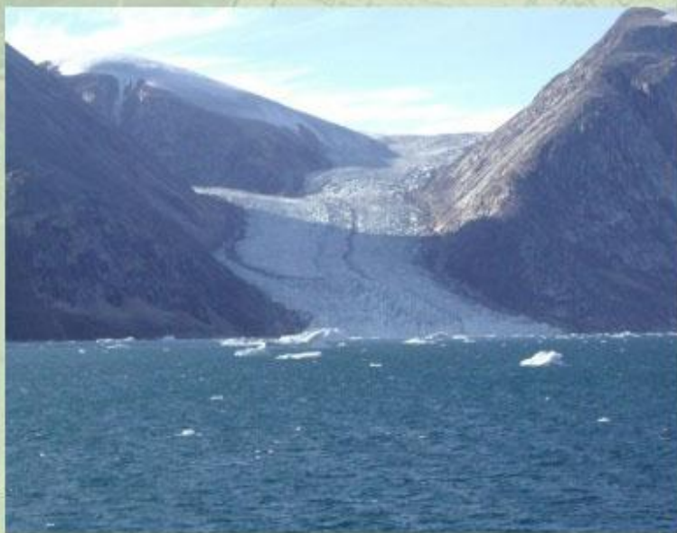
Ледник в Гренландии.