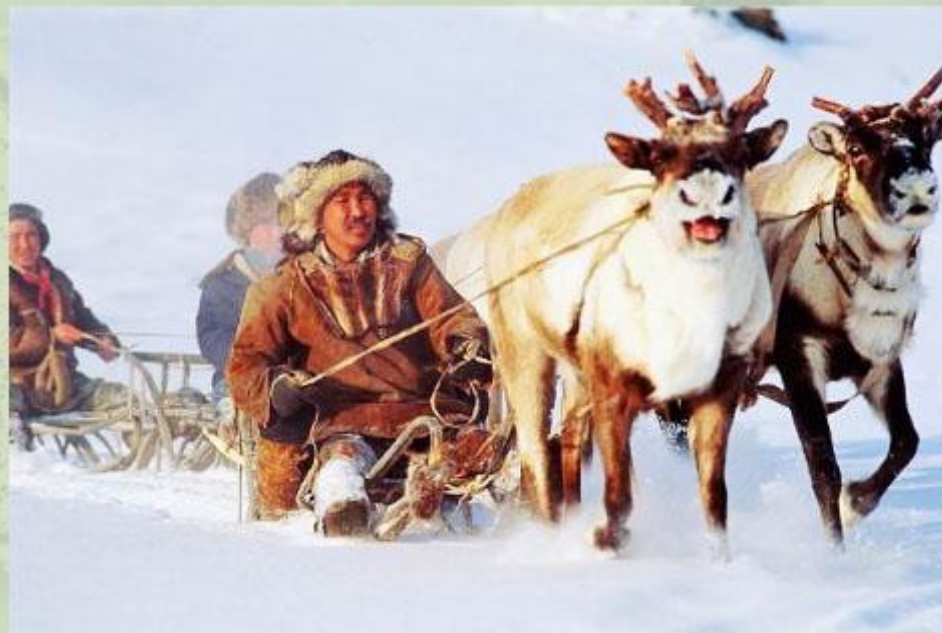
Оленья упряжка - основное средство передвижения в Арктике.