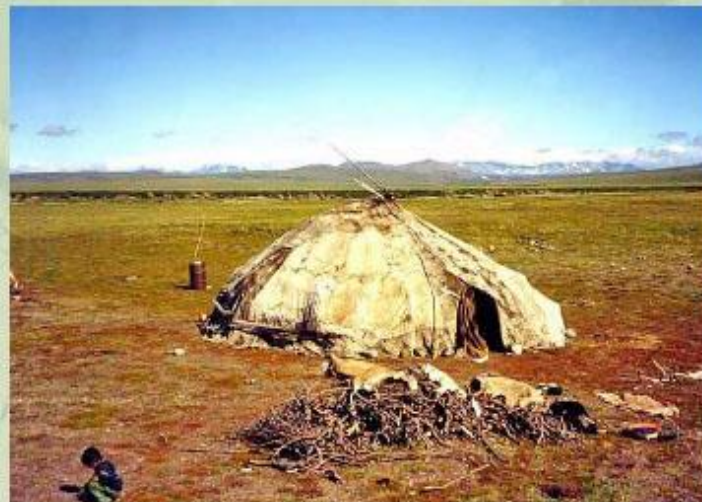
Чум, крытый оленьими шкурами - традиционное жилище народов Севера.

Малочисленные народы Севера проживают в крайне суровых условиях. Подробнее познакомиться с жизнью малых народов, их бытом и культурой вы сможете, прочитав энциклопедическую статью.