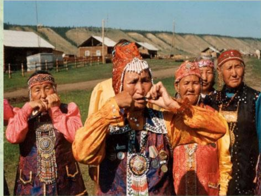
Национальный инструмент народов Севера - хомус.