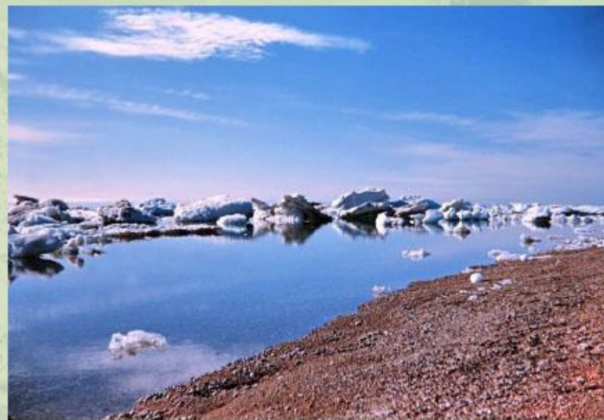
Канадский Арктический архипелаг.

Рельеф островов и арктических побережий материков весьма разнообразен. Примерно 4/5 Гренландии , самого большого острова Земли (2175,6 тыс. км 2 ), покрыто ледниковым покровом мощностью до 3500 м. Во многих местах Арктики распространены горные хребты, увенчанные ледниками.