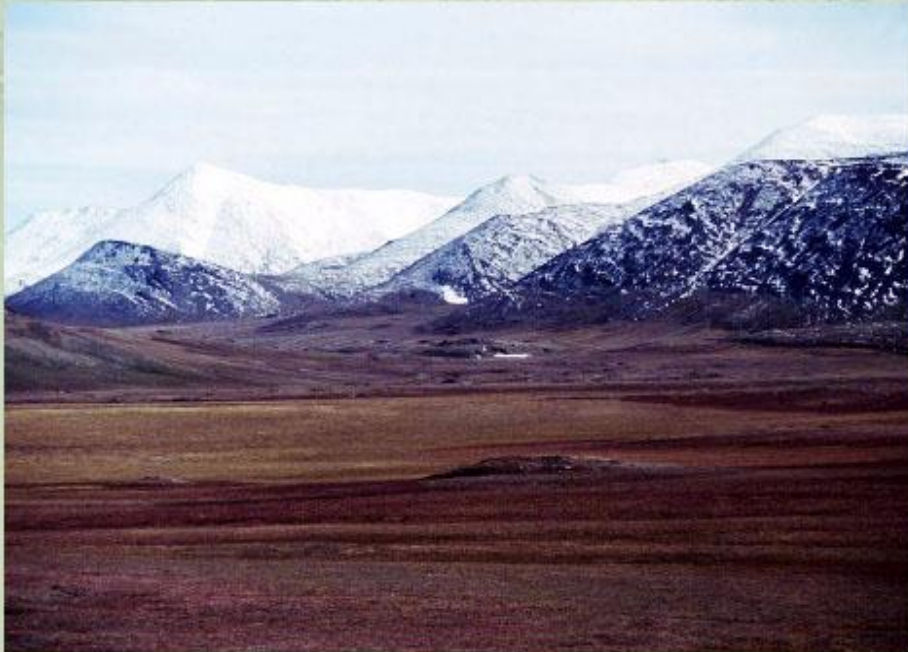
Остров Врангеля в российской Арктике.

Горы занимают обширные территории на северо-востоке Сибири, встречаются также на Новой Земле и на п-ове Таймыр. Волнистые равнины, покрытые тундровой растительностью, характерны для запада Канадского Арктического архипелага и материковых районов к западу от Гудзонова залива , а также для северного побережья Аляски. Большая часть арктического побережья России - низкая равнина с тундровой растительностью и небольшими холмистыми участками. Почти повсеместно в Арктике распространена многолетняя мерзлота.