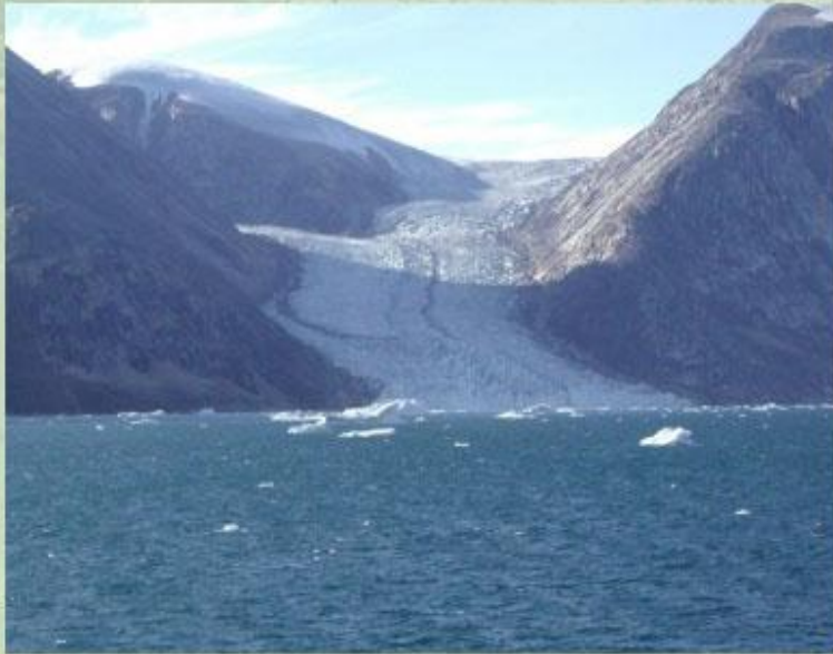
Ледник в Гренландии.