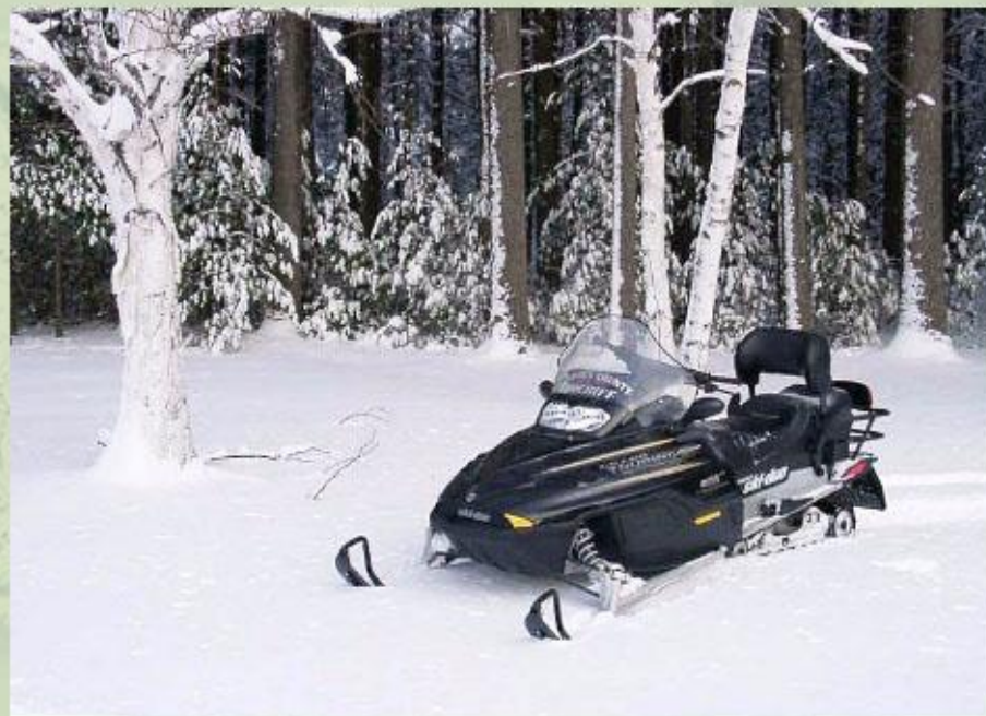
...вытесняется современными снегоходами.