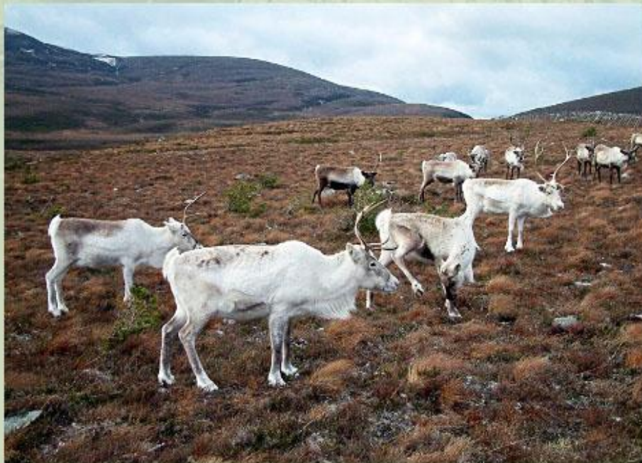
Традиционное занятие народов Севера - оленеводство.