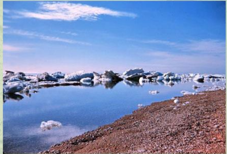
Канадский Арктический архипелаг.

Рельеф островов и арктических побережий материков весьма разнообразен. Примерно 4/5 Гренландии , самого большого острова Земли (2175,6 тыс. км 2 ), покрыто ледниковым покровом мощностью до 3500 м. Во многих местах Арктики распространены горные хребты, увенчанные ледниками.