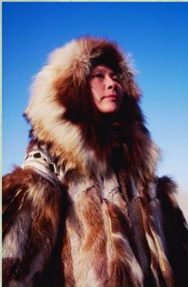
Одежда народов Севера.