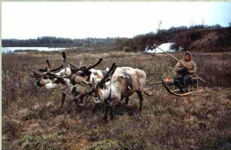
Ненцы - жители Севера.