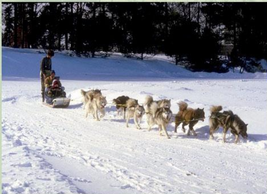
Собачья упряжка в Арктике...