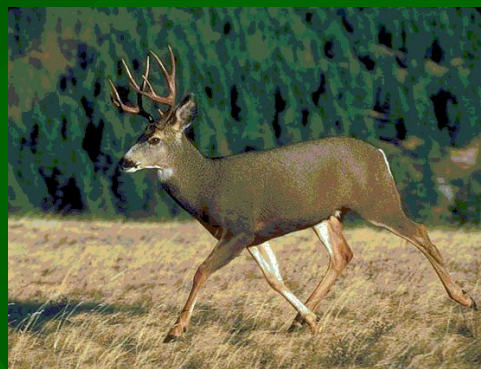
Қара құйрықты бұғы