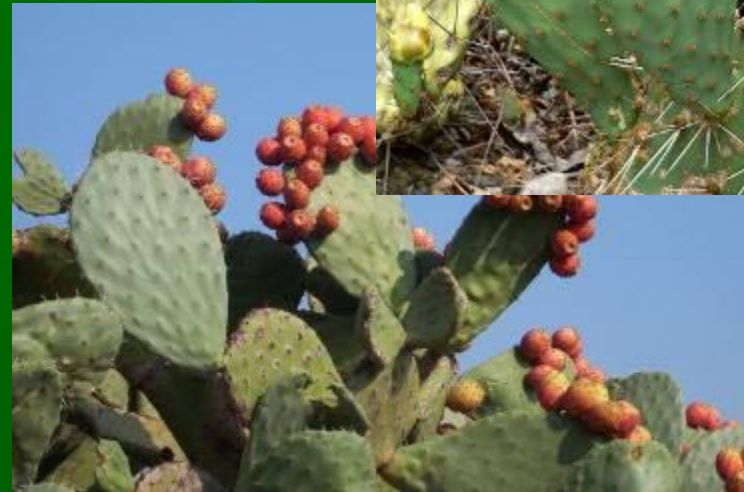
О П У Н Ц И Я