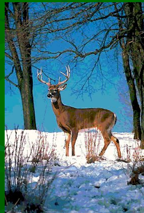
Ақ құйрықты бұғы