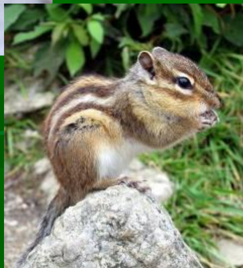
Сұр ала тышқан