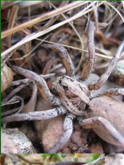
ТА РА АН ТУ Л