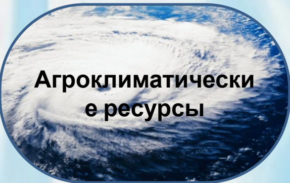
Агроклиматически е ресурсы