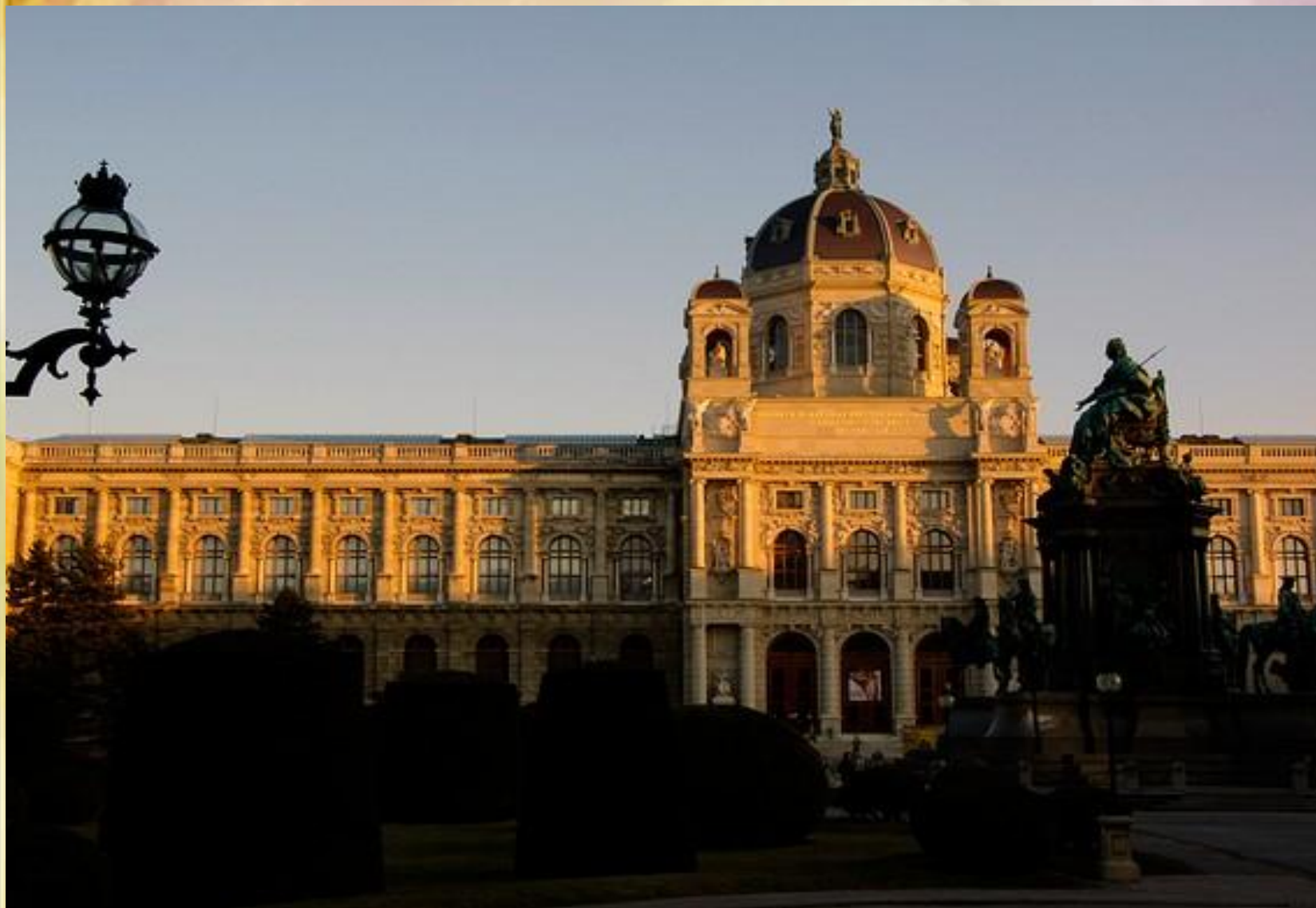
Музей истории искусств, Вена

Венский Музей истории искусств был открыт в 1891 году. Выполненное в стиле итальянского Ренессанса здание музея содержит несколько тематических коллекций картин.