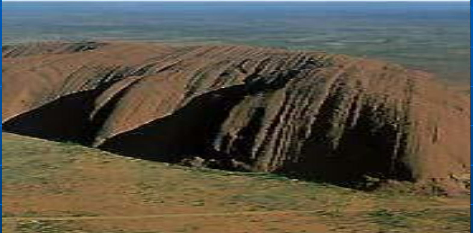
Скала Эйса (Центральная Австралия).