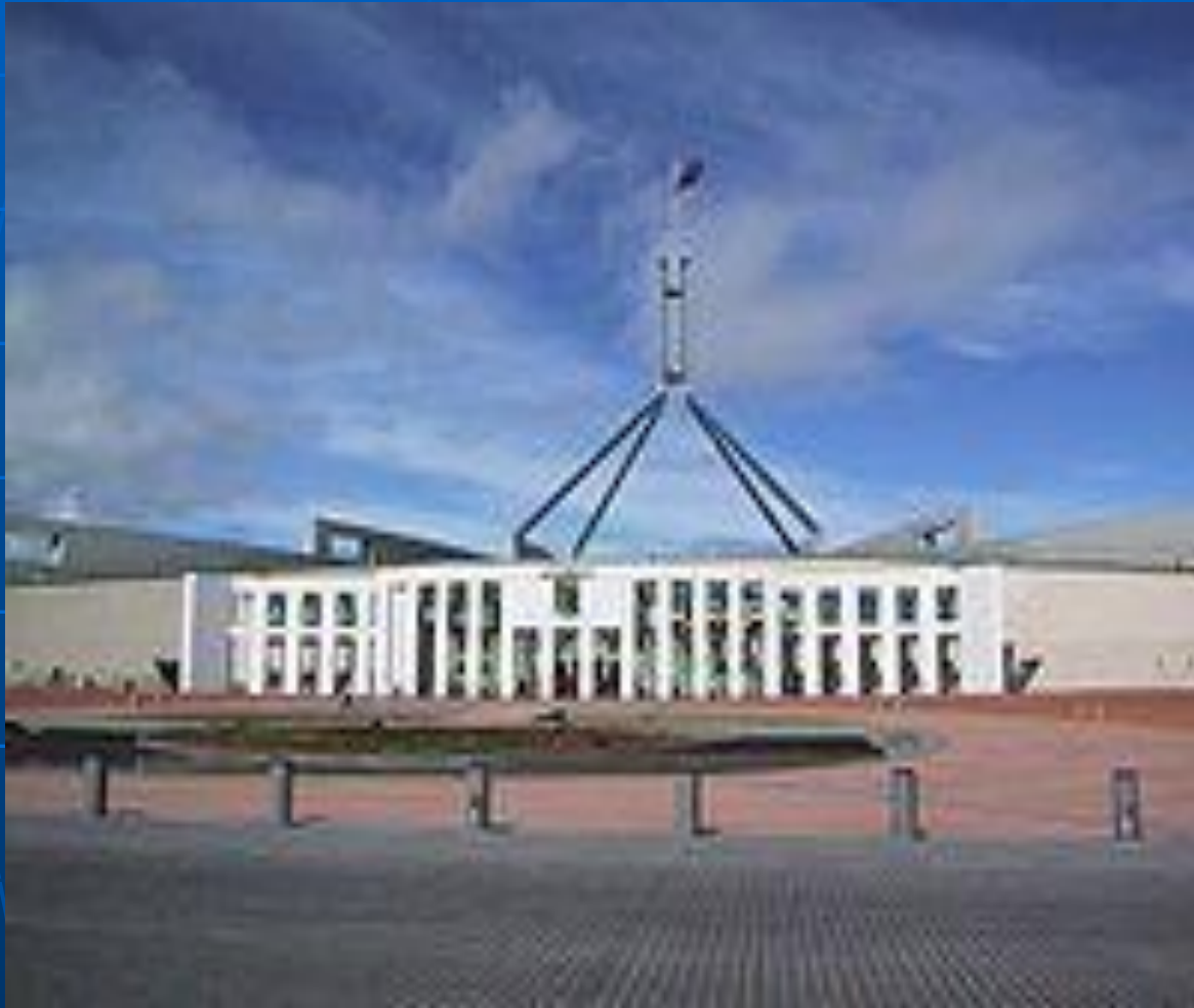
Новое здание Парламента .