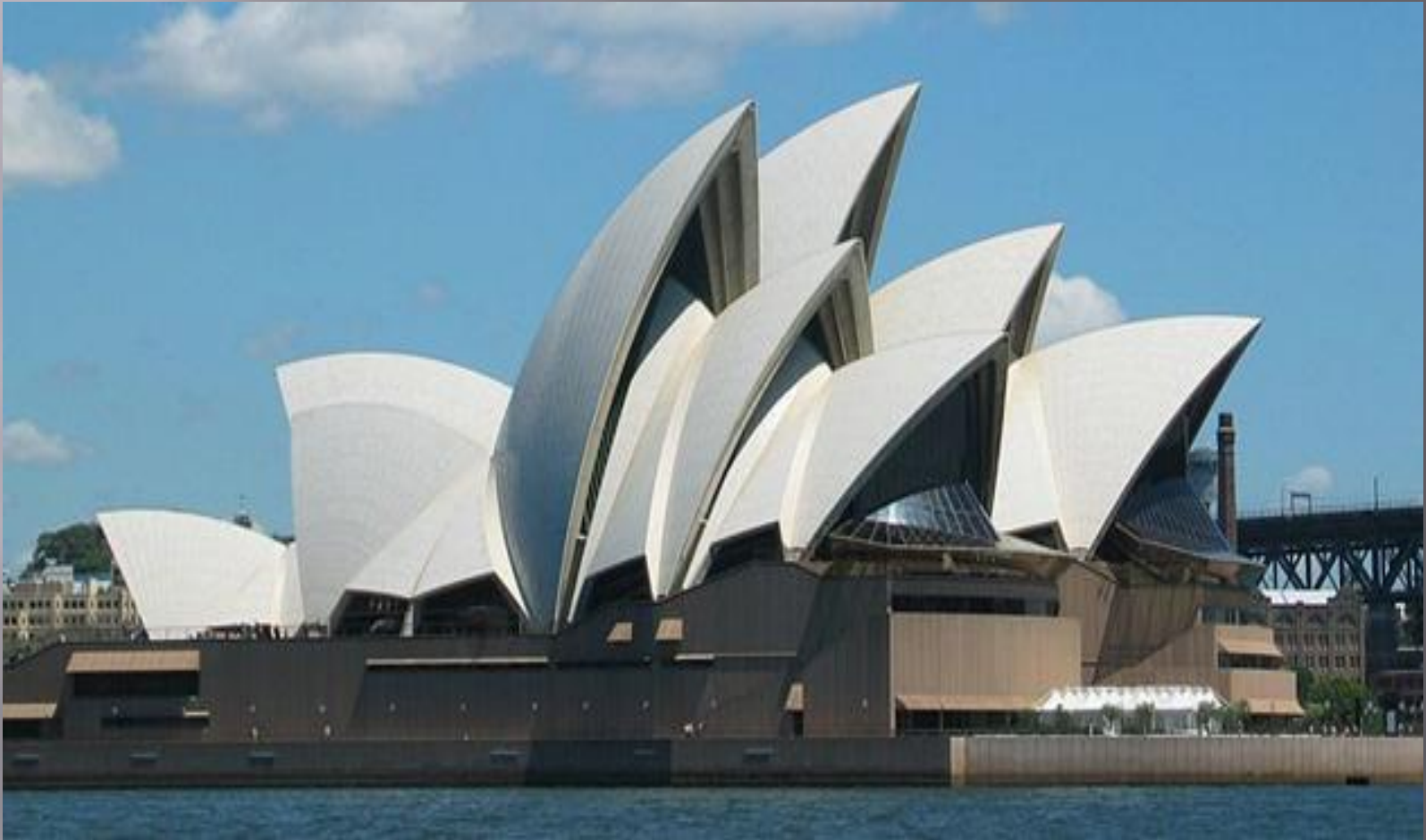
Сиднейский оперный театр (Опера Хаус)