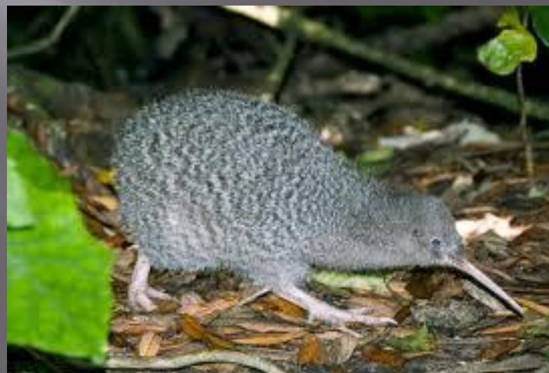
Бескрылая птица Киви