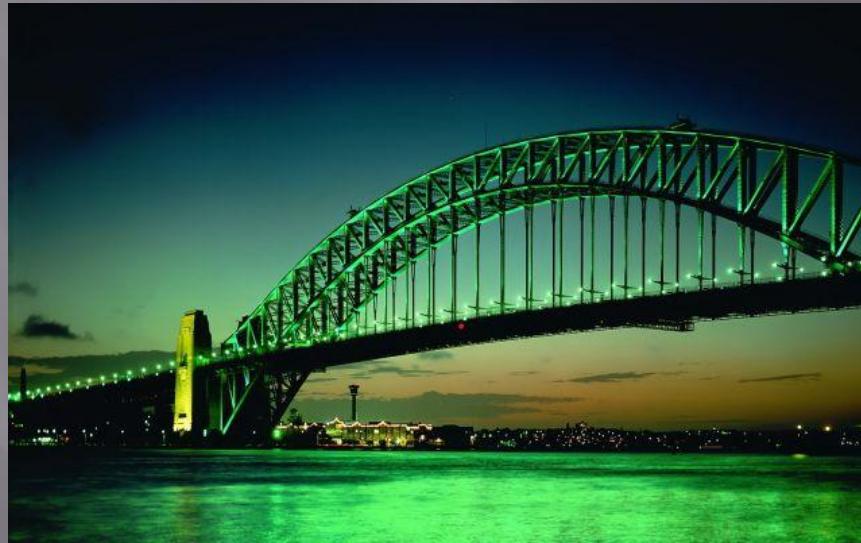
Мост Харбор Бридж