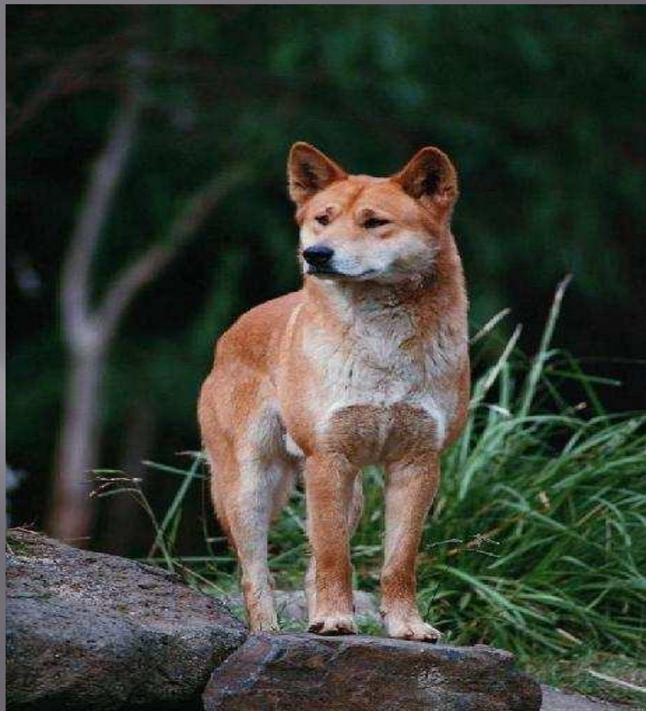
Дикая собака Динго