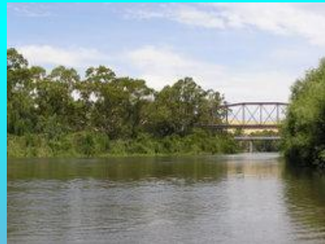
Река Маррамбиджи вблизи города Гандагай