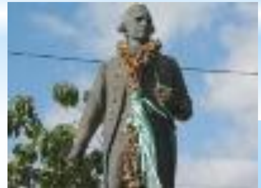
Памятник Джеймсу Куку в Сиднее.

В районе современного Сиднея в 18 веке высадились англичане. «Первый флот» (11 судов) доставил сюда 850 каторжан и около 200 солдат и офицеров. Под грохот пушек и кандаальный звон началась колонизация Австралии.