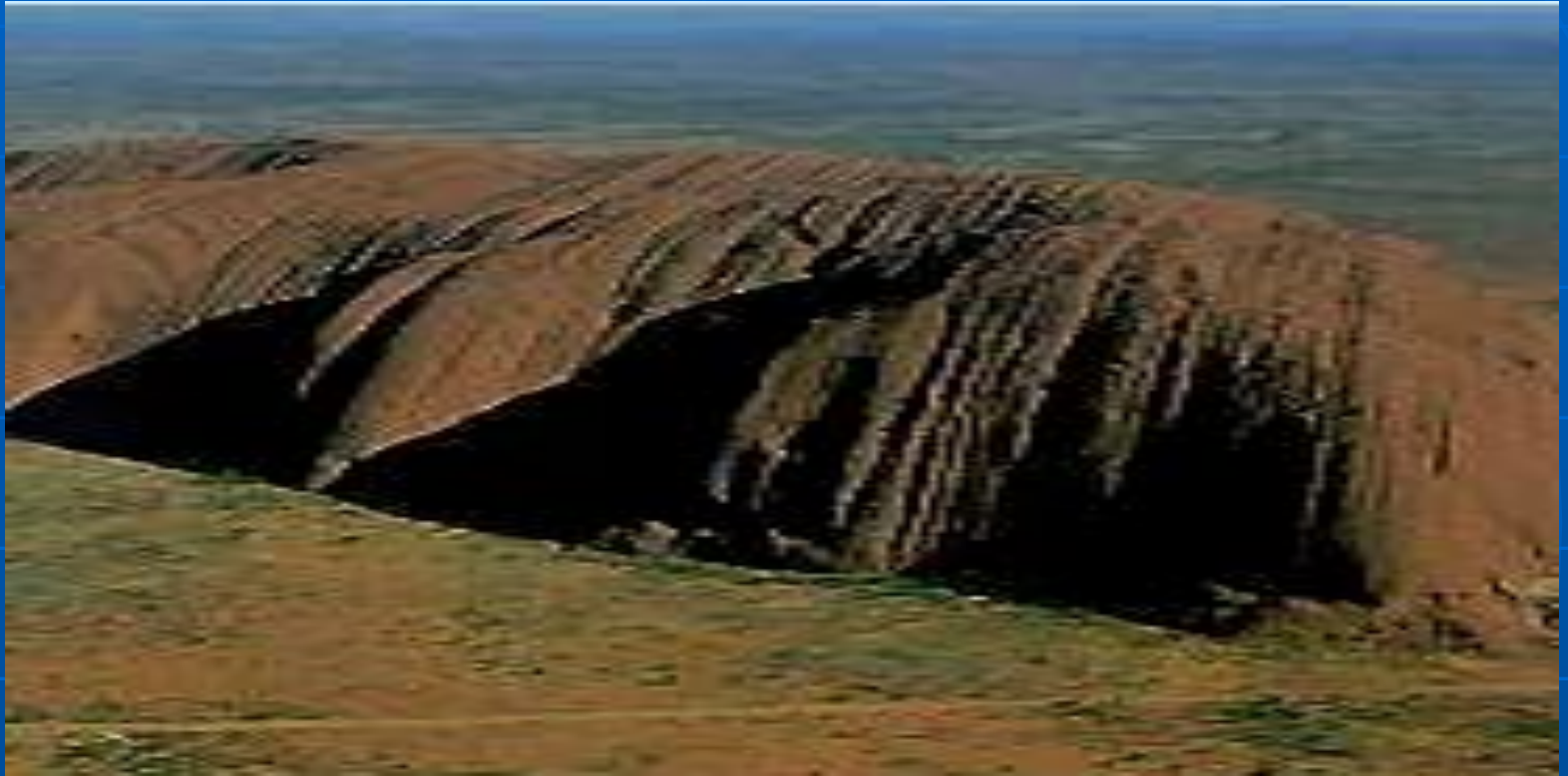
Скала Эйса (Центральная Австралия).