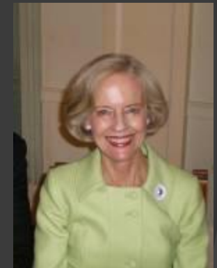
Квентин Брюс генерал-губернатор Австралии