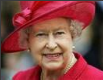
Елизавета II Королева Великобритании