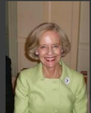
Квентин Брюс генерал-губернатор Австралии