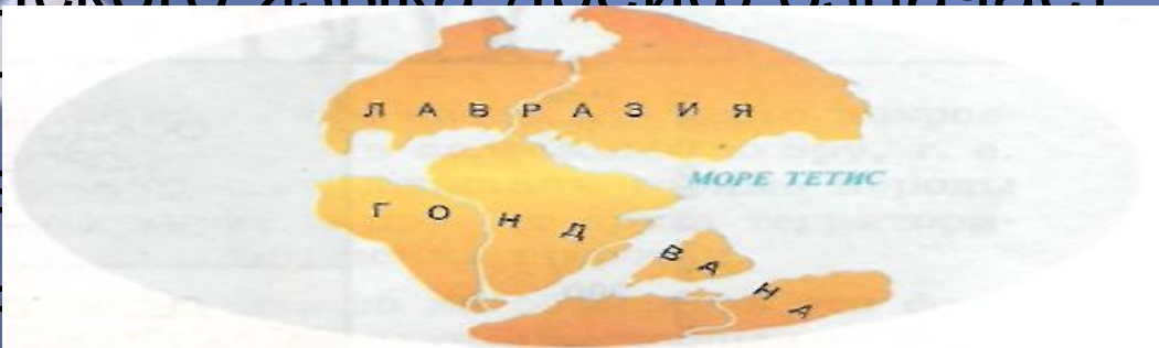
Рис. 3. Поверхность Земли 180 млн лет назад