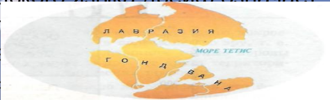
Рис. 3. Поверхность Земли 180 млн лет назад