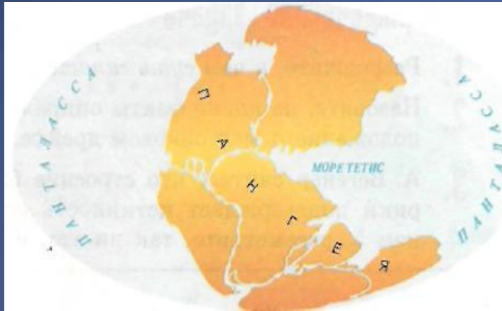
Рис. 2. Поверхность Земли 200 млн лет назад. Названия Пангея и Панталасса происходят от греческих pan— «вся», ge— «земля», talas-sa — «море». Название Тетис — от имени греческой богини моря Thetis