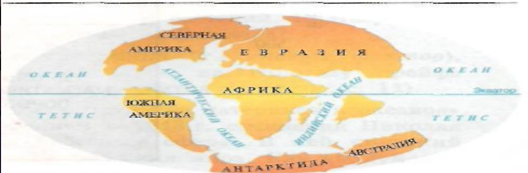
Рис. 4. Поверхность Земли 65 млн лет назад