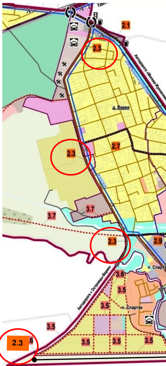
Таблица № 2.5.1 том 1 проекта Генплана с.п. Верейское

Карта транспортной инфраструктуры с.п. Верейское (2.3)