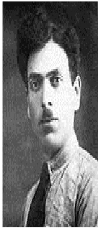
Автор музыки гимна Узеир Гаджибеков (слева) и автор слов — Ахмед Джавад (справа)

● Гимн Азербайджана называется «Марш Азербайджана!» (азерб. «Azərbaycan Marşı!» («Азәрбајчан Маршы»)). Мелодия гимна написана азербайджанским композитором Узеиром Гаджибековым, слова поэтом Ахмедом Джавадом (азерб. Əhməd Cavad) в 1918 году. Он являлся официальным гимном ещё досоветского Азербайджана. Гимн был официально принят (повторно после утверждения в 1918 и отмены в 1920) в 1991 году после восстановления независимости Азербайджана.