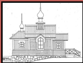
Эскиз Ажеровской домово́й церкви

В Ажеровском доме ночевали раз в году монахи, сопровождавшие чудотворную икону Югской Божьей Матери. С этой иконой монахи обходили Мологско-Рыбинскую область. Икона «ночевала» в нашей маленькой, старенькой деревянной церкви, где служили по этому поводу (я не помню молебен или литургию, по рассказам бабушки). «Диванная» была уставлена большим количеством угловых и всяких других диванов из лакированной карельской березы, крытых темно-красным кретоном. Впоследствии наша маленькая деревянная церковь сгорела. ( Из воспоминаний А.М. Азанчеева )