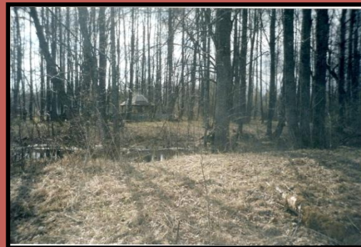
Местечко Ажерово Современный вид