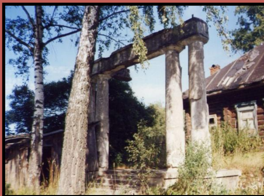
Остатки ворот усадьбы Горшково

В 12 км от Ажерово находилась летняя резиденция Азанчеевых Горшково ( Мурзино). Горшково расположено на берегу извилистой речки Ильди, с красивыми весёлыми берегами. От реки шёл пологий откос, по нему направо от дороги огород, оранжерея, за ней уже парадный сад с клумбами и дорожками, ещё правее берёзовая роща, овраг и опять пологий скат, спускавшийся к той же Ильди и на противоположном её берегу опять берёзовая роща ближайших наших соседей – Соковниных.