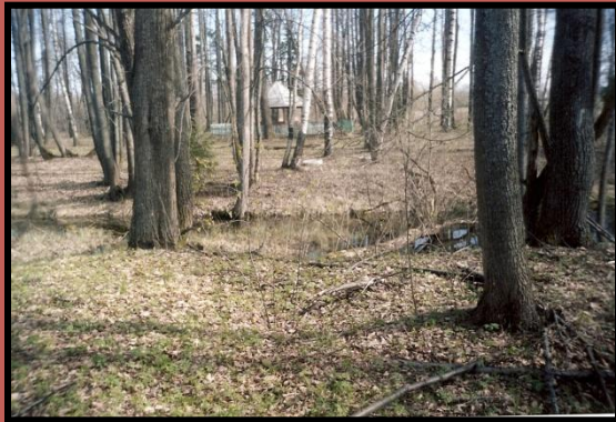
Пруд для отдыха Современное состояние