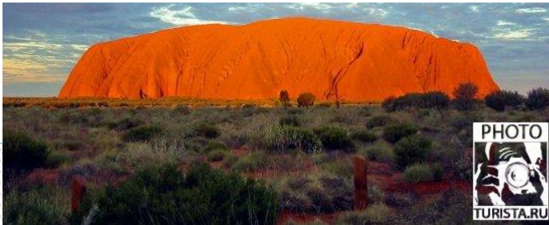
Священная гора Улуру