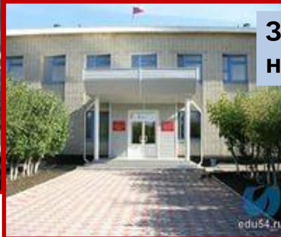
Здание Администрации нашего района