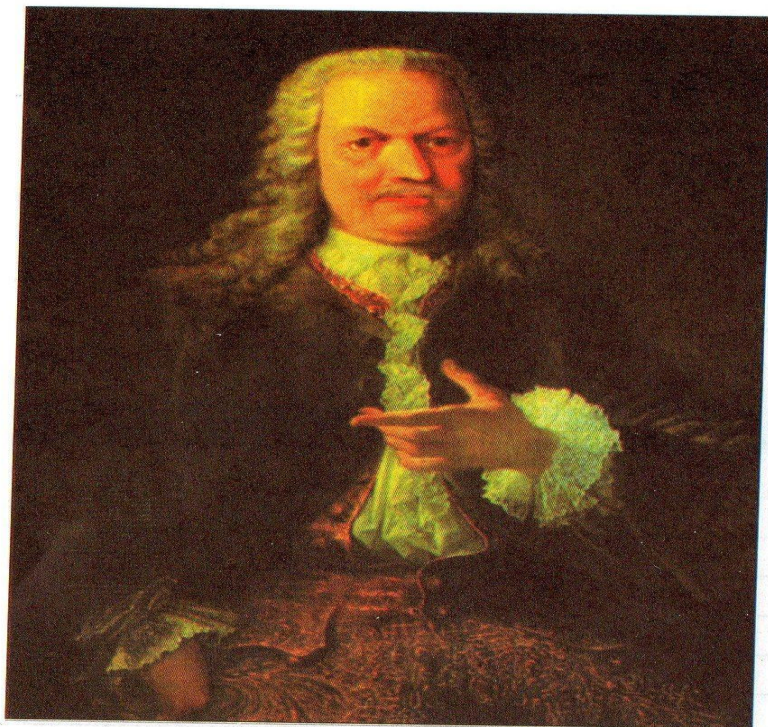
Портрет А. Демидова. Из фондов Алтайского государственного краеведческого музея.