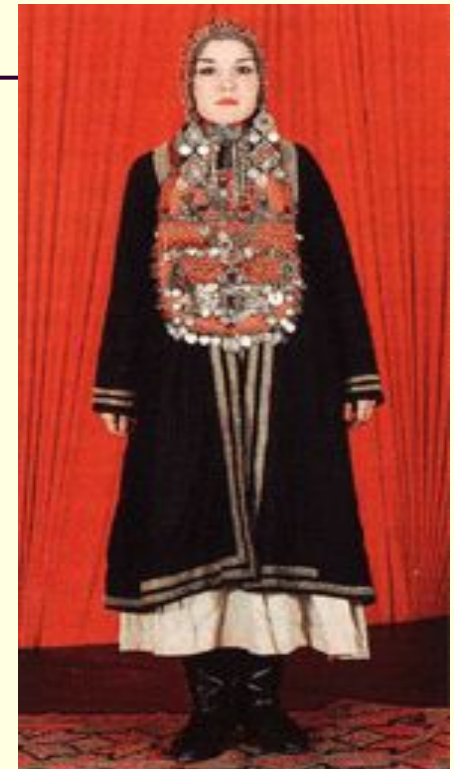
Башкирский женский костюм

Прямоспинного покроя черная верхняя одежда - елян , удлиненный нагрудник- селтэр с бахромой, плотно охватывающая голову коралловый кашмау придавали облику женщины величие и монументальность. В состав праздничной одежды населения долины реки Демы входили примерно те же предметы, что и на юго-востоке Башкортостана: халат елян , головной убор - кашмау , нагрудник - сакал . Своеобразная форма этих вещей придавала демскому костюму иной облик. Суженный в талии елян , мягко закругленный сакал делали костюм этих мест легким и изящным. Исключительную красочность костюму курганских башкир придавали нагрудник с кораллами и звенящими монетами.