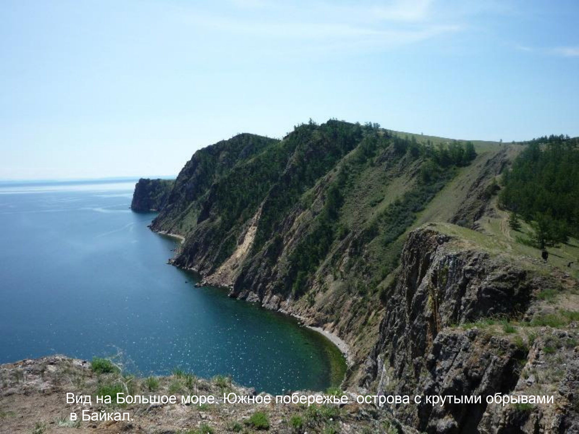
Вид на Большое море. Южное побережье острова с крутыми обрывами в Байкал.