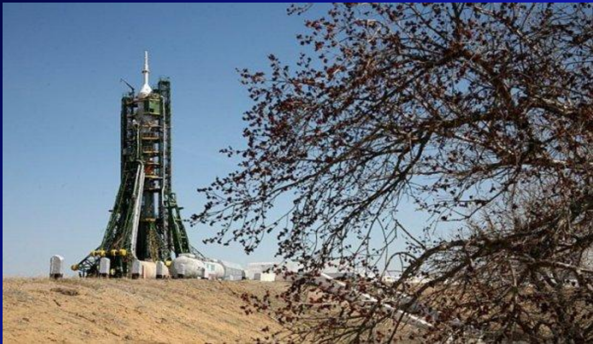
Ракета на стартовой площадке