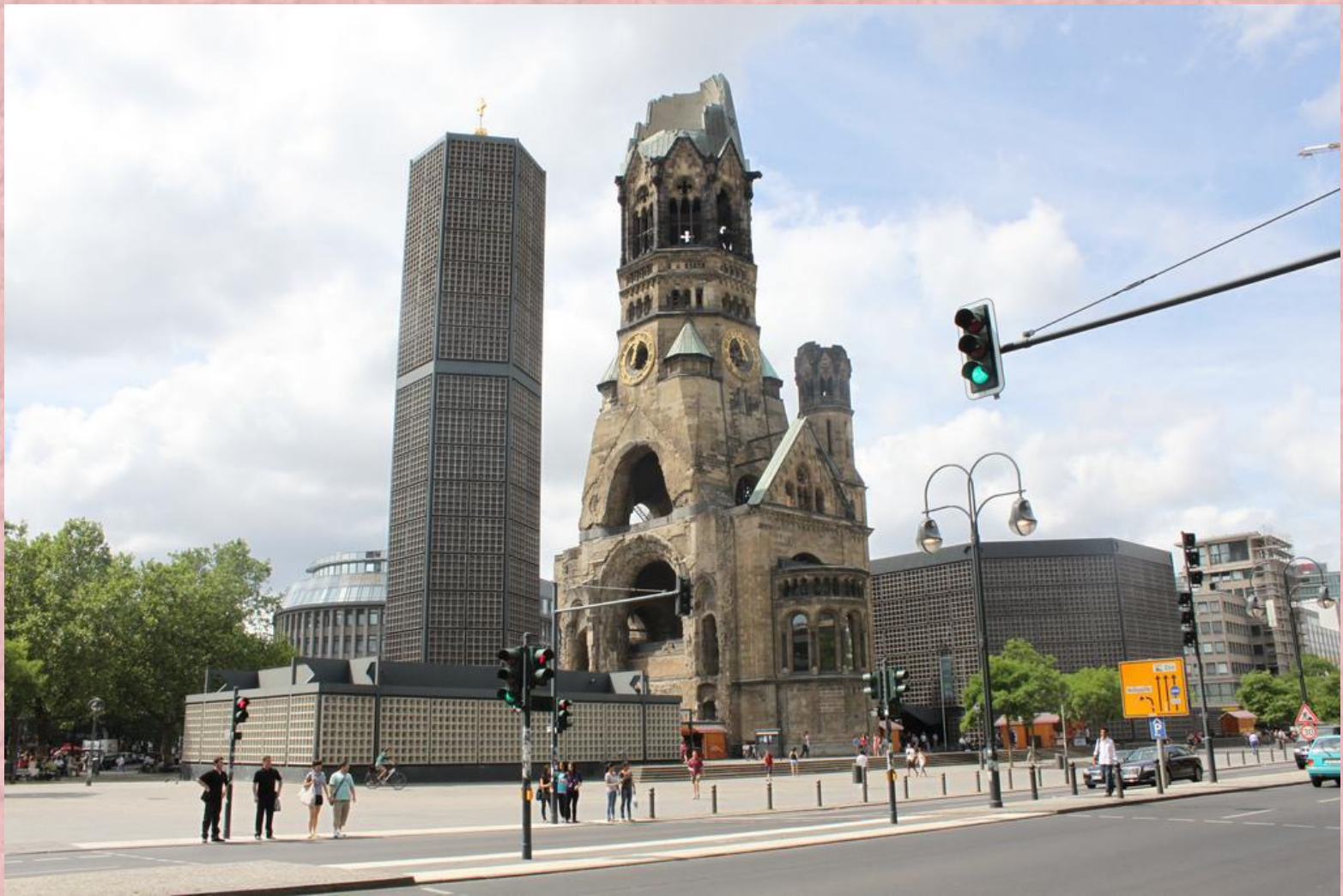
Kaiser-Wilhelm-Gedächtniskirche - die protestantische Kirche befindet sich am Breitscheidplatz.