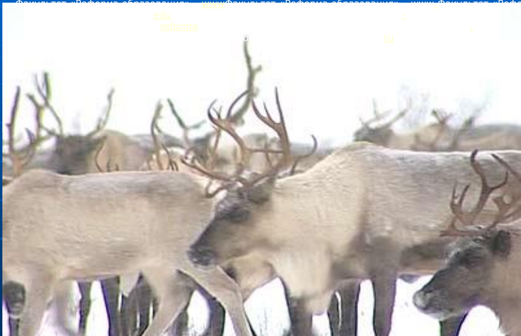
Северные олени – самые крупные травоядные животные Крайнего Севера. Держатся большими стадами. Это единственные олени у самок которых есть рога.