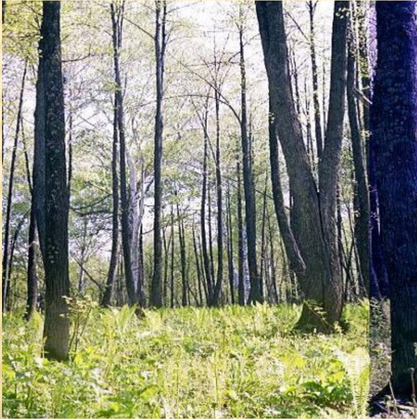
Кузедеевский липовый остров – остаток теплолюбивых широколиственных лесов третичного периода