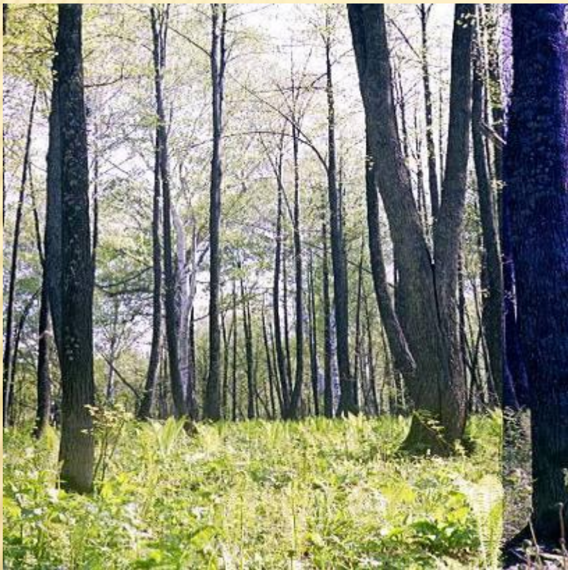
Кузедеевский липовый остров – остаток теплолюбивых широколиственных лесов третичного периода