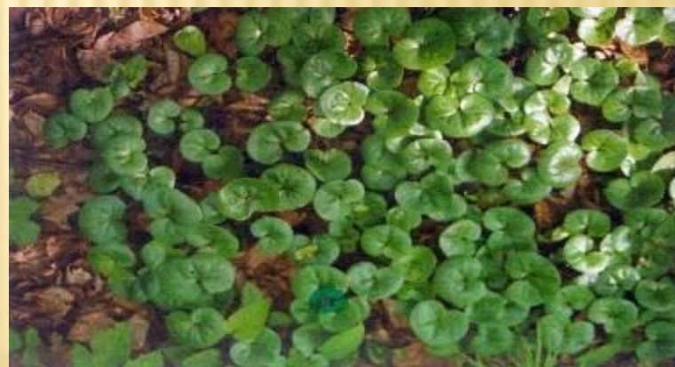
Копытень европейский – третичный реликт