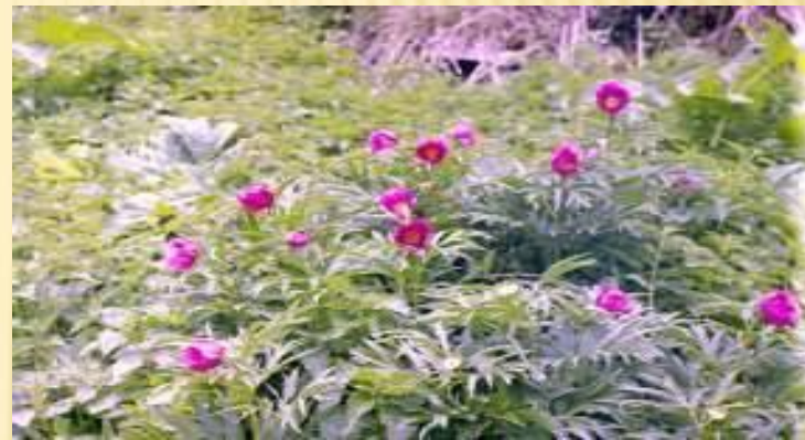
Пион – редкий исчезающий вид