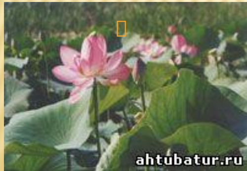
Лотос-реликтовый цветок фараонов