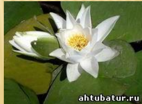
Чилим или водный орех