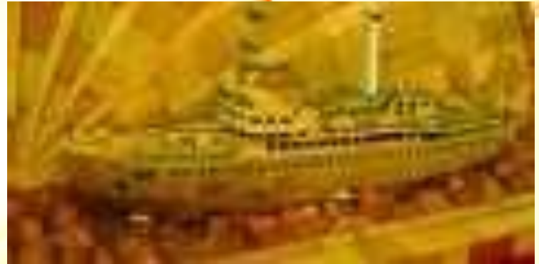
Модель атомохода «Ленин»