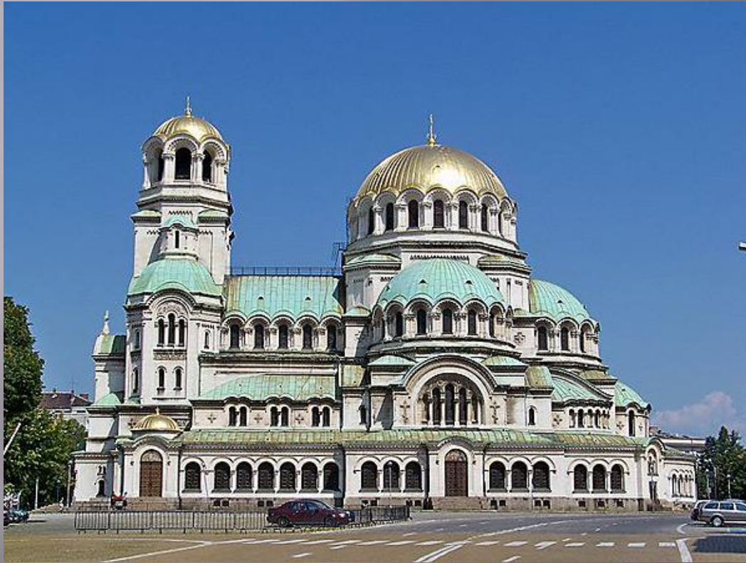
Храм-памятник Александра Невского

Главный собор Софии и Болгарии вообще стоит на площади Александра Невского и поражает воображение своей сложной архитектурой и внушительным обликом. Это огромный собор, способный вместить одновременно до пяти тыс. верующих. Он был возведён в честь освобождения Болгарии в ходе русско-турецкой войны: первый камень заложили в 1882 г., но само строительство началось в 1904 г. Этот процесс продолжался восемь лет, и в 1912 г. храм был освящён. В 1944 г. при бомбардировках храм серьёзно пострадал, но