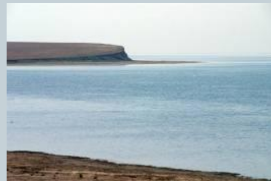
Озеро Маныч-Гудило, одно из водно-болотных угодий России