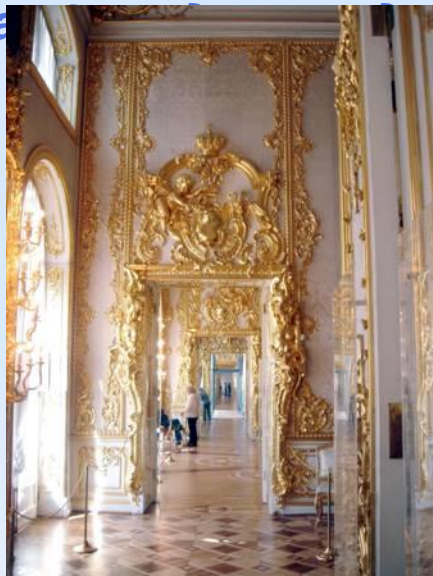
«Золотая анфилада» залов