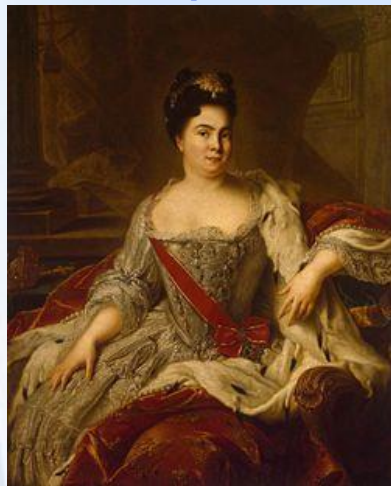
Жан-Марк Наттье. Портрет Екатерины I. 1717

Своим существованием Екатерининский (Большой) дворец обязан его блистательным хозяйкам, трем императрицам — Екатерине I, Елизавете Петровне и Екатерине II . Им принадлежал дворец в XVIII веке, и они уделяли его строительству огромное внимание. Их фантазии и личные вкусы воплощали в жизнь сотни талантливых