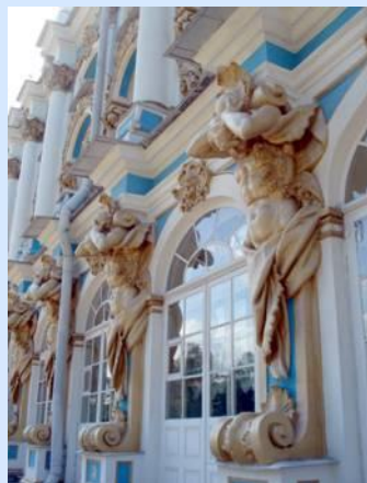
Скульптура на венчающей балюстраде, атланты и маскароны в обрамлении окон (скульптор И. Дункер)

Купола дворцовой церкви. и поражающая скульптура, фасад придает особый язык