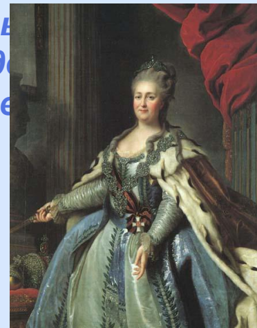
Рокотов Федор Портрет Екатерины II.