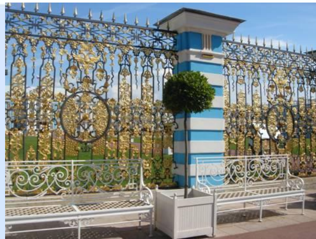
Екатерининский дворец. Решетка Парадного двора

Екатерининский дворец прекрасен и снаружи, и внутри. Его фасады, сияющие чистой лазурью, цветущие скульптурным убранством таят в себе множество драгоценностей - залов и комнат, которые иначе как