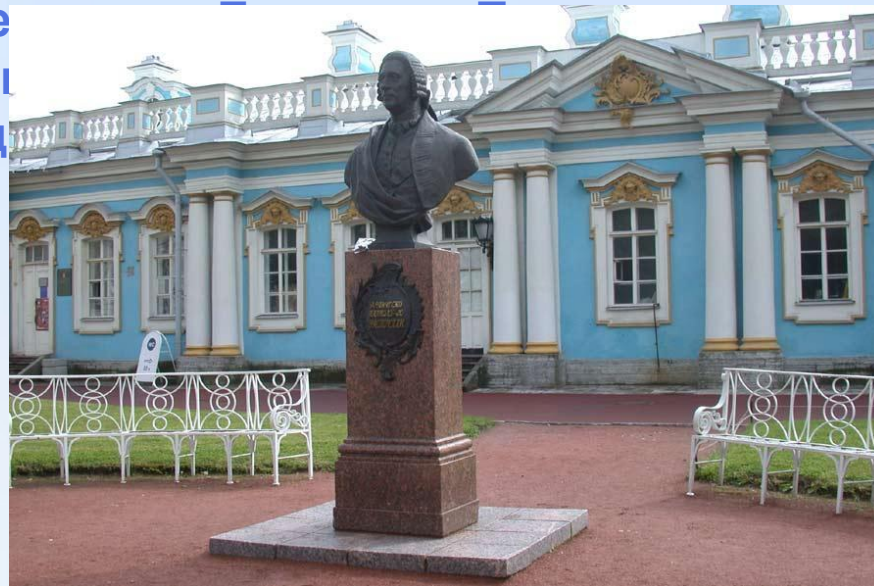
Екатерининский (Большой) дворец в Царском селе. Арх. Ф.Б. Растрелли. 1752—1756. Памятник Ф. Б. Растрелли. 1991