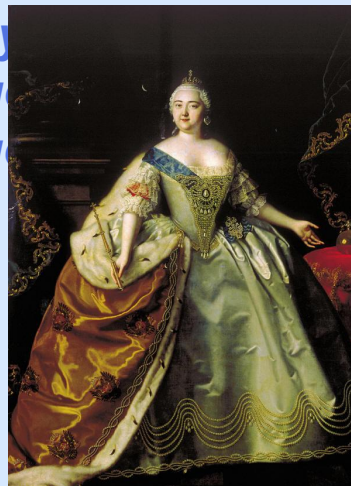
Луи Каравакк Портрет императрицы Елизаветы Петровны 1750