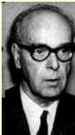
Мехмед Меша Селимович