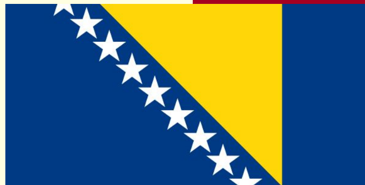
Флаг Боснии и Герцеговины