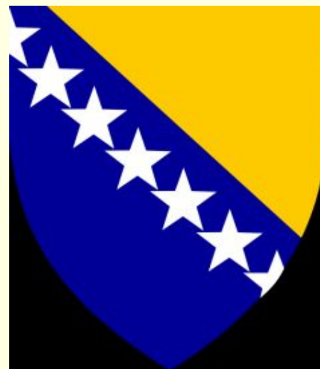
Герб Боснии и Герцеговины