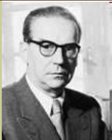
Иво Андрич (1892–1975)