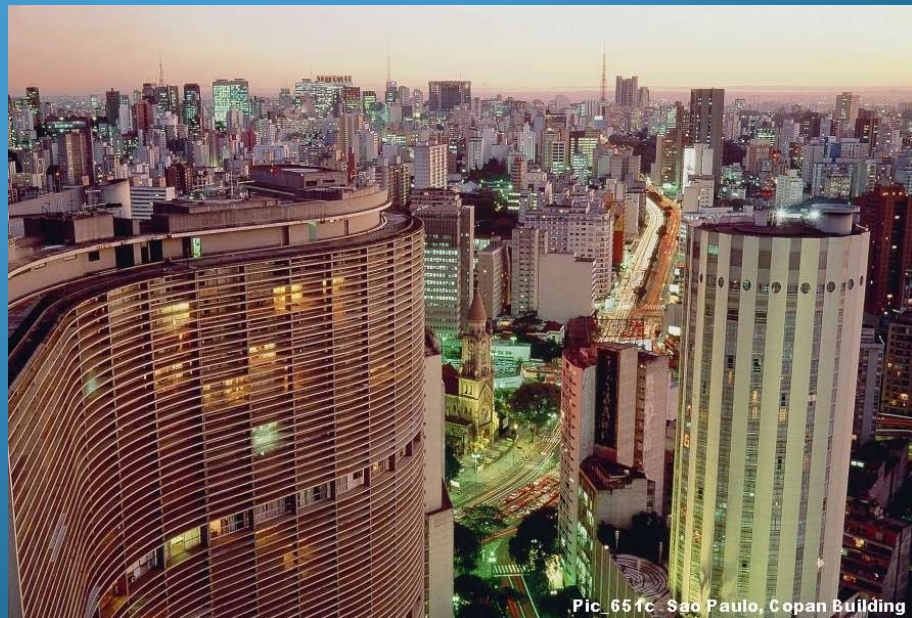
Pic. 65 1c. Sao Paulo, Copan Building