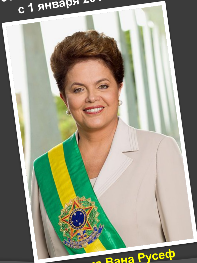
Дилма Вана Русефф

36-й президент Бразилии с 1 января 2011 года