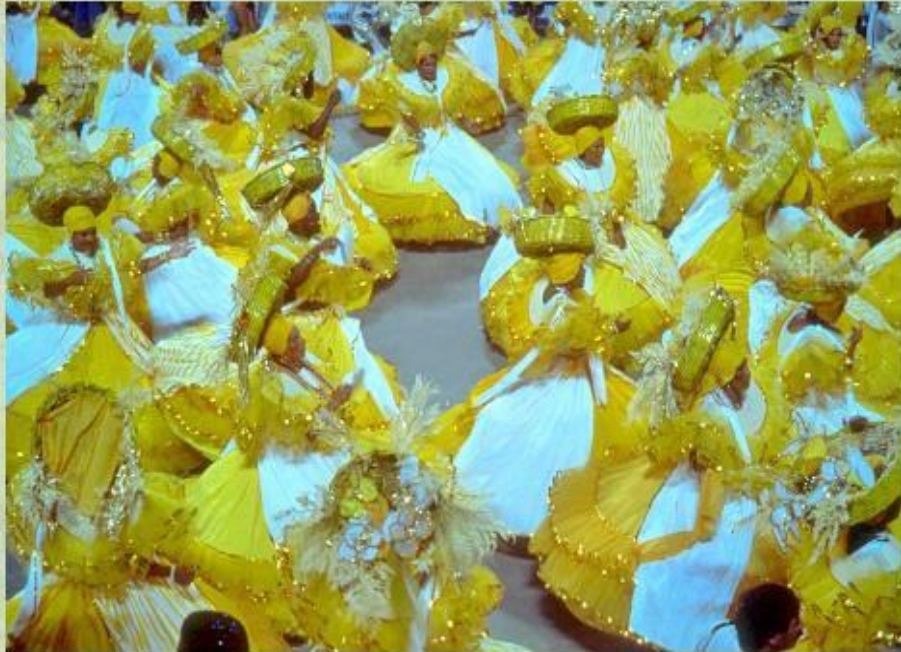
Карнавал в Рио-де-Жанейро.