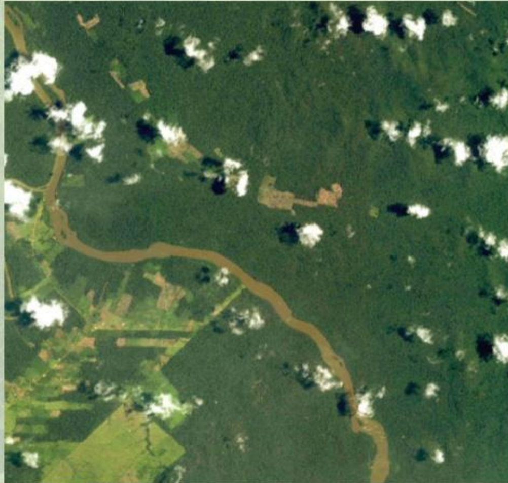
Амазонская низменность (фотография из космоса).