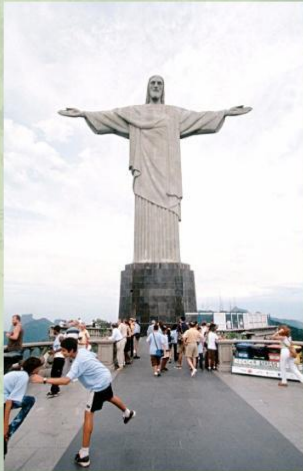
Статуя Христа в Рио-де-Жанейро.

Бразилия является одной из ведущих стран в своем регионе по развитию туризма. Туристов привлекают не только протяженные океанические пляжи, но и традиционные праздники в современных городах. Карнавал в Рио-де-Жанейро и футбольные баталии многократных чемпионов мира собирают десятки тысяч поклонников со всего мира.