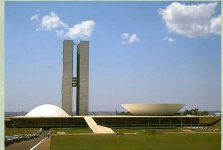
Новая столица Бразилии – город современной архитектуры.

Бразилия - крупнейшее по площади и численности населения государство материка, занимающее по этим показателям пятое место в мире. Название страны связывают с мифическим островом Бразил, где растет красное дерево. С XVI по XIX вв. страна была португальской колонией.