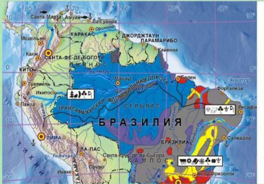
Экономическая карта Бразилии.

Экономическая палитра Бразилии столь же разнообразна, как и природная. В экономике страны сахарная и золотая «лихорадка» сменяли кофейный и каучуковый бум. Сегодня наряду с мировым лидерством в традиционных отраслях (выращивание кофе, сахарного тростника, бананов) страна развивает автомобилестроение, производит современную электронику. Обширность территории, богатство и разнообразие природных условий и ресурсов определили динамичное развитие страны, живущей под лозунгом «Порядок и прогресс».