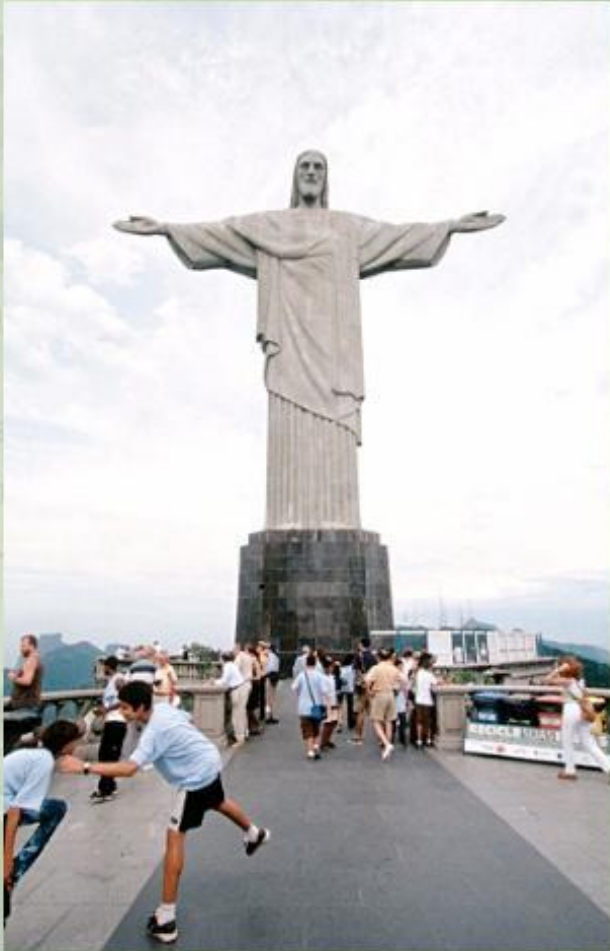
Статуя Христа в Рио-де-Жанейро.

Бразилия является одной из ведущих стран в своем регионе по развитию туризма. Туристов привлекают не только протяженные океанические пляжи, но и традиционные праздники в современных городах. Карнавал в Рио-де-Жанейро и футбольные баталии многократных чемпионов мира собирают десятки тысяч поклонников со всего мира.