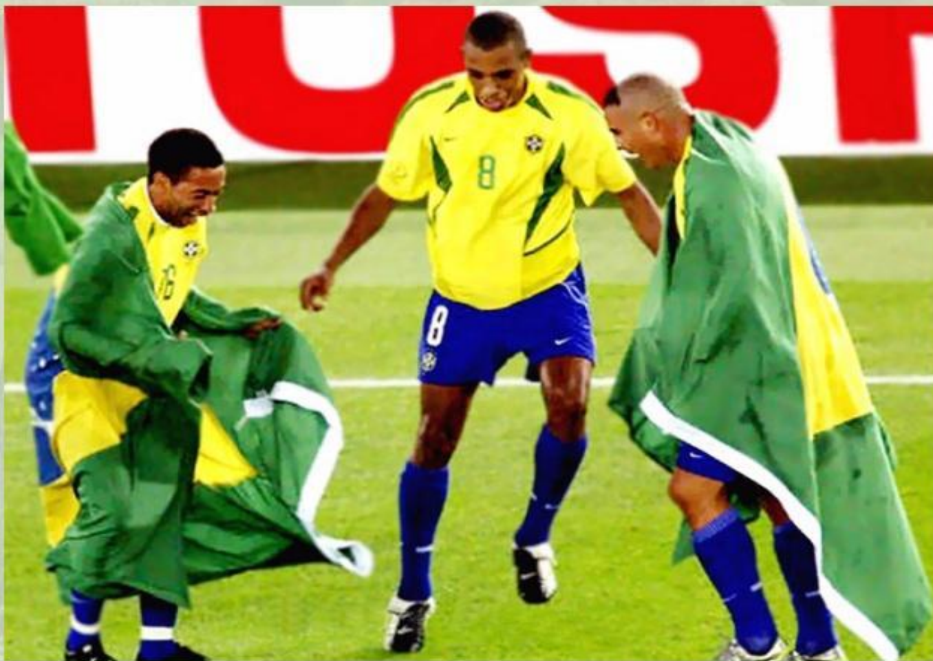
Футбол в Бразилии.