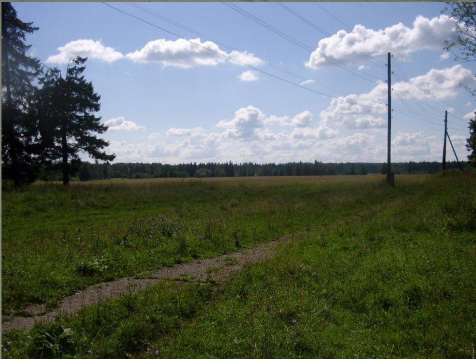
На горизонте – опушка Бушковского леса