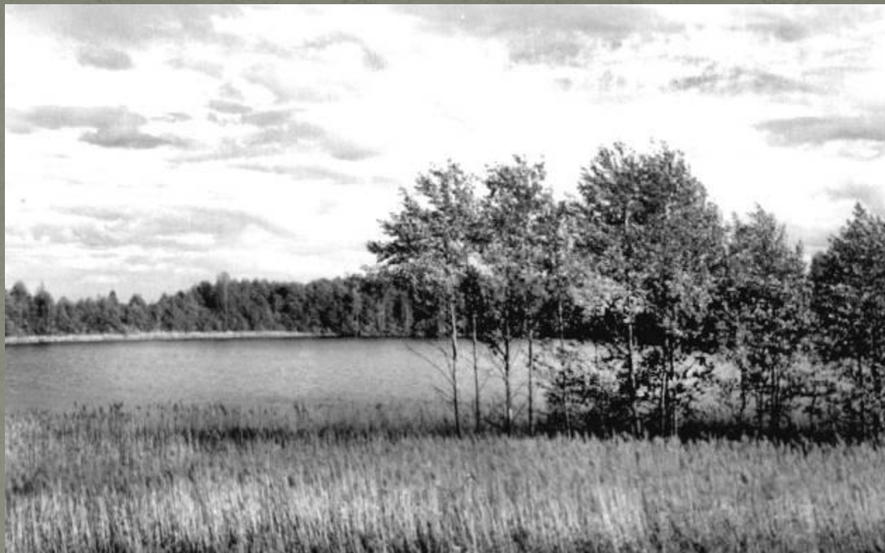
Вид на озеро Мусерское