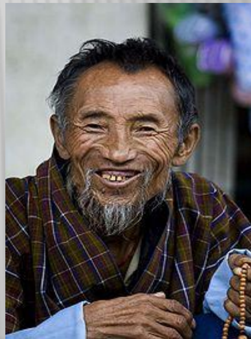
Типичный представитель коренного населения Бутана

Мужчины носят гхо, или тяжёлый халат длиной до колен, который подпоясывают поясом. Женщины носят красочные блузки, поверх которых надевают большой прямоугольный кусок ткани, называемый кира. Поверх кира может носиться короткий шелковый жакет, или тего. Повседневные гхо и кира делаются из хлопка или шерсти, в зависимости от времени года, и украшаются простыми узорами в виде полос и клеток.