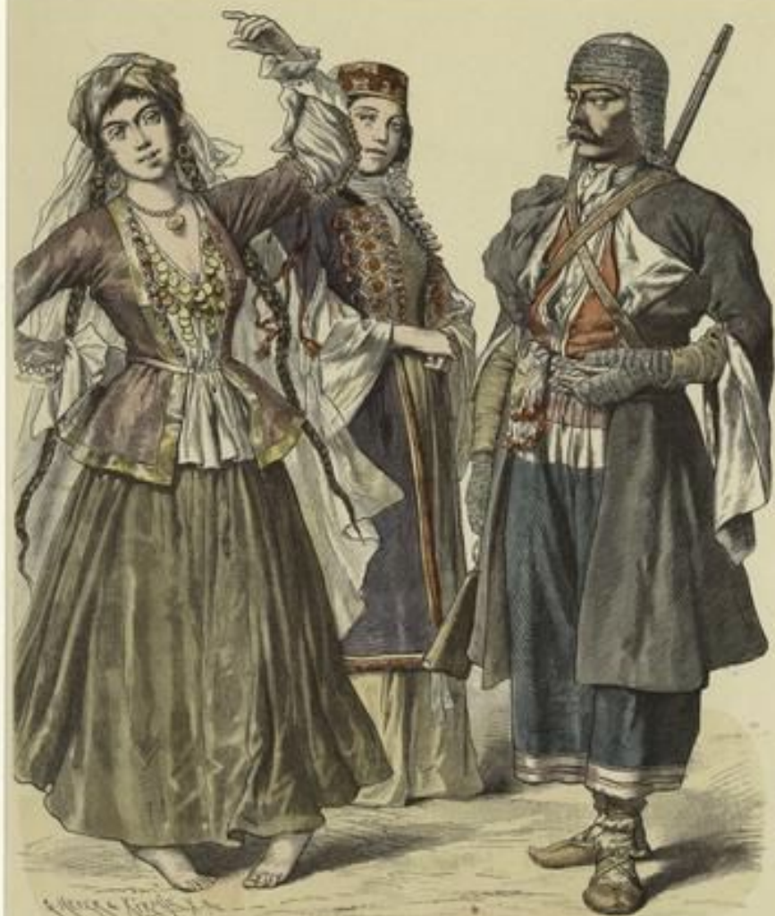
Vajadere aus Chematba.