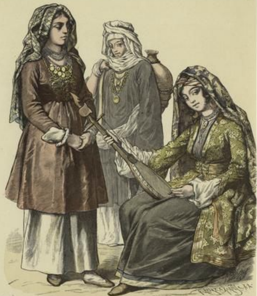
Circassier aus Shevsar.