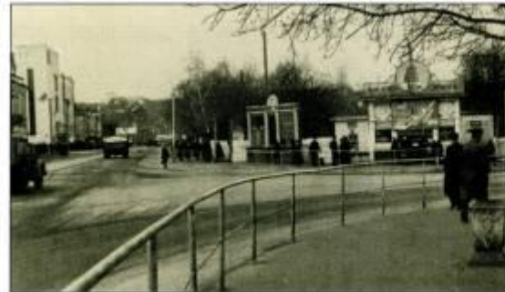
Вход в парк им. Н. К. Крупской, 1955 г.