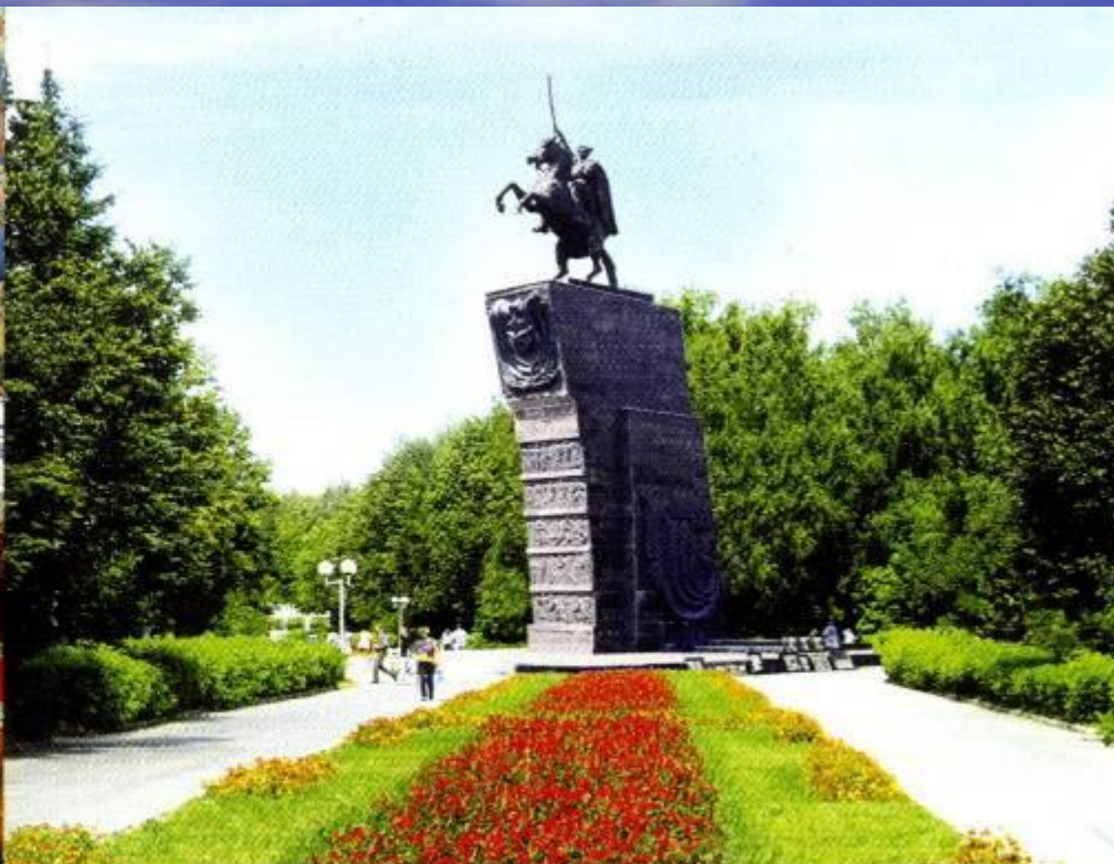
Памятник В. И. Чапаеву

«...имя его войдет в историю гражданской войны блестящей звездой. И есть за что: таких, как он, было немного...»