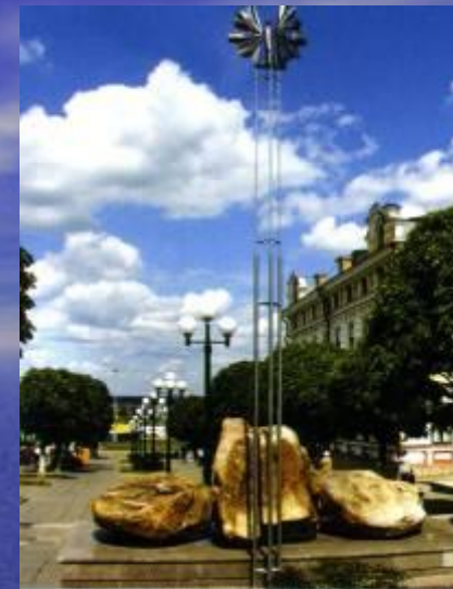
"Птица счастья" и Таганаит - камень солнца и любви.