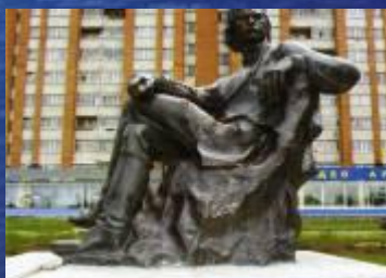
Памятник А.М. Горькому