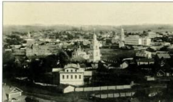
Панорама г. Чебоксары, начало XX века.