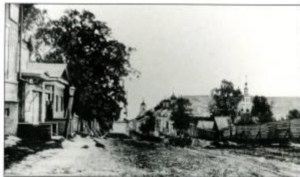
Ул. Соборная (К. Иванова), 1900 г.