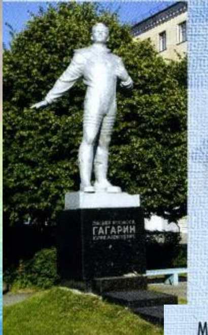
Памятник Ю.А. Гагарину