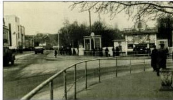
Вход в парк им. Н. К. Крупской, 1955 г.