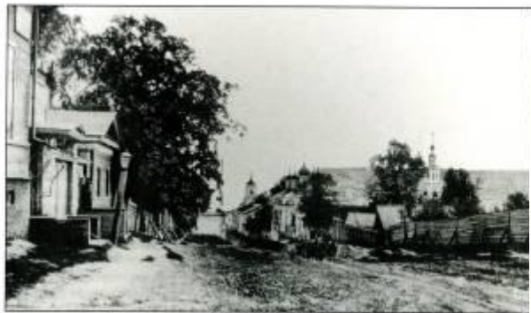
Ул. Соборная (К. Иванова), 1900 г.