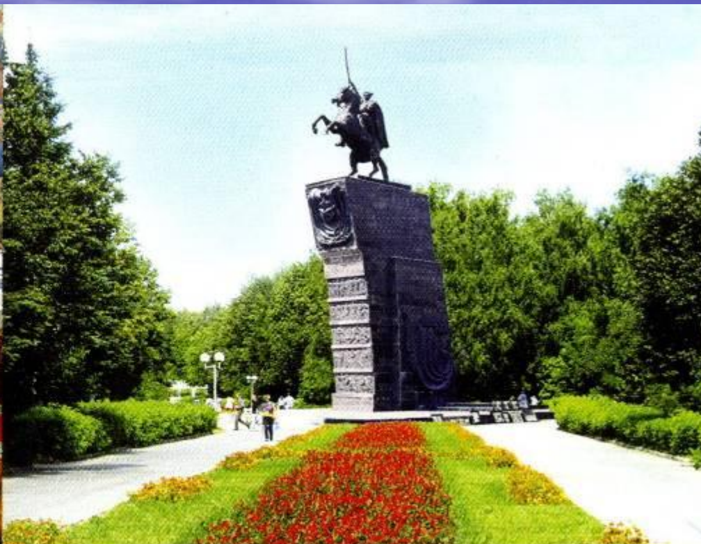
Памятник В. И. Чапаеву

«...имя его войдет в историю гражданской войны блестящей звездой. И есть за что: таких, как он, было немного...»