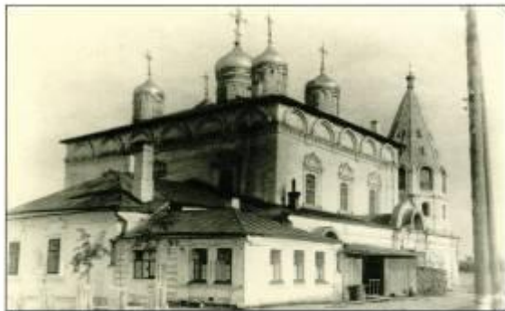
Введенский собор, начало XX века.