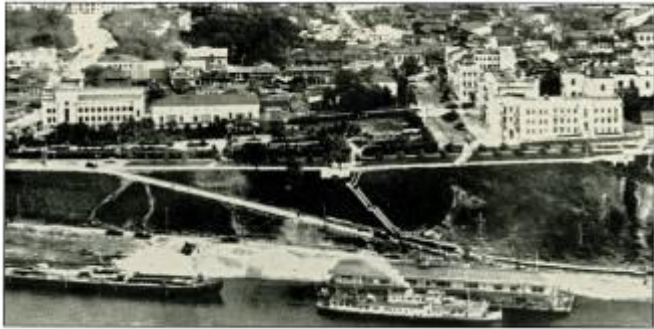
Панорама г. Чебоксары с самолета, 1951 г.