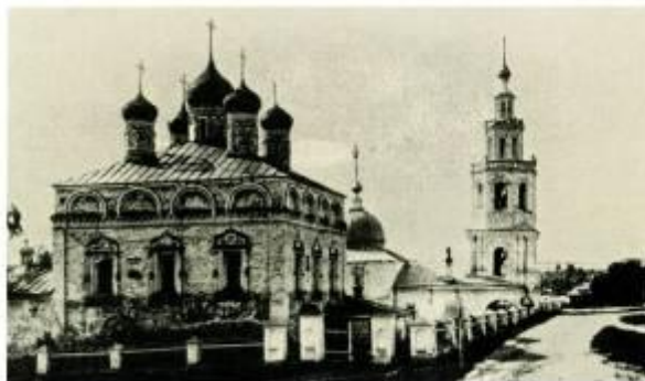
Церковь Михаила Архангела, начало XX в.