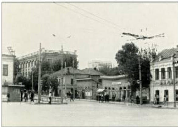
Красная площадь, август 1975 г.