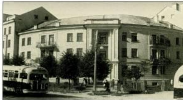
Перекресток улиц К. Маркса и Волзарского, 1960-е годы.