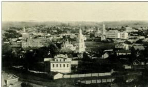
Панорама г. Чебоксары, начало XX века.