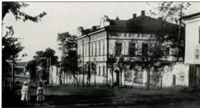
Ул. К. Маркса, 1924 г.