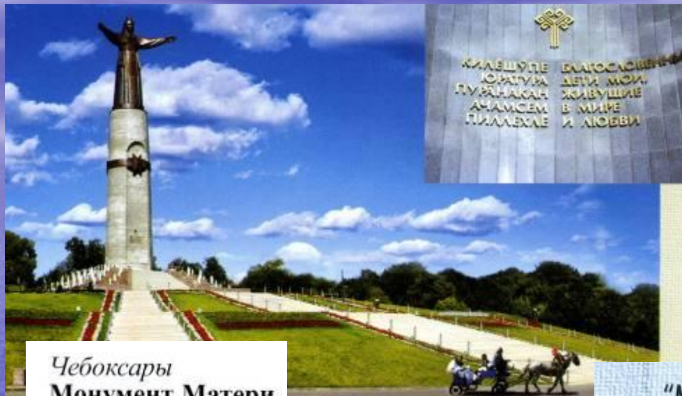
Чебоксары Монумент Матери.