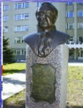
Памятник П.Е. Егорову - архитектору, автору ограды Летнего сада в Санкт-Петербурге