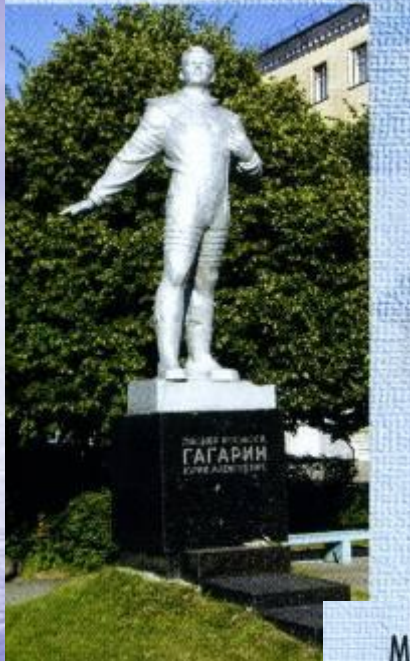
Памятник Ю.А. Гагарину