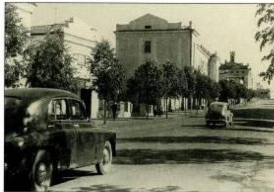
Ул. К. Маркса, начало 1960-х годов.