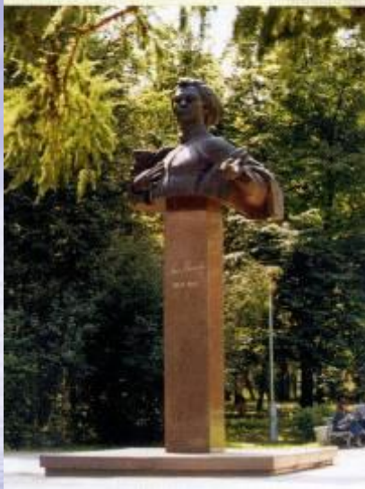
Михаил Сеспель - основоположник чувашской советской поэзии