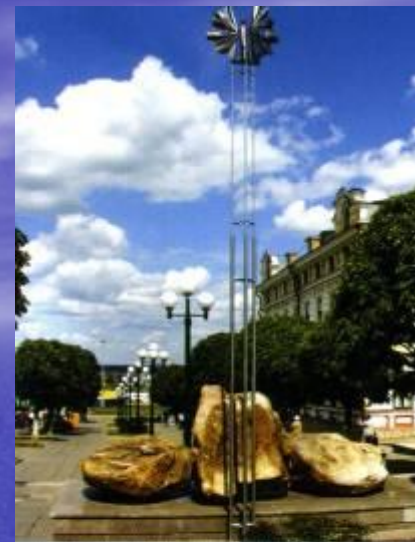
"Птица счастья" и Таганаит - камень солнца и любви.