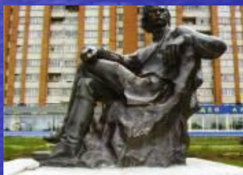
Памятник А.М. Горькому