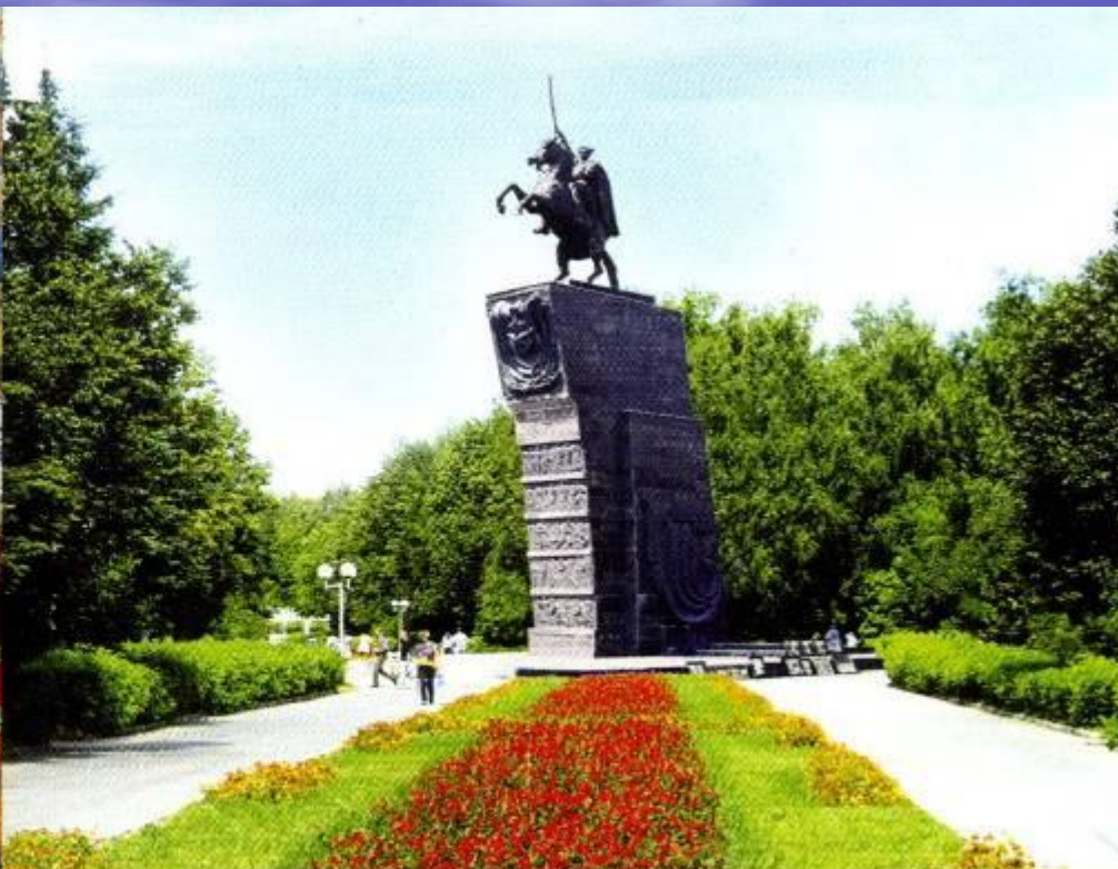
Памятник В. И. Чапаеву

«...имя его войдет в историю гражданской войны блестящей звездой. И есть за что: таких, как он, было немного...»