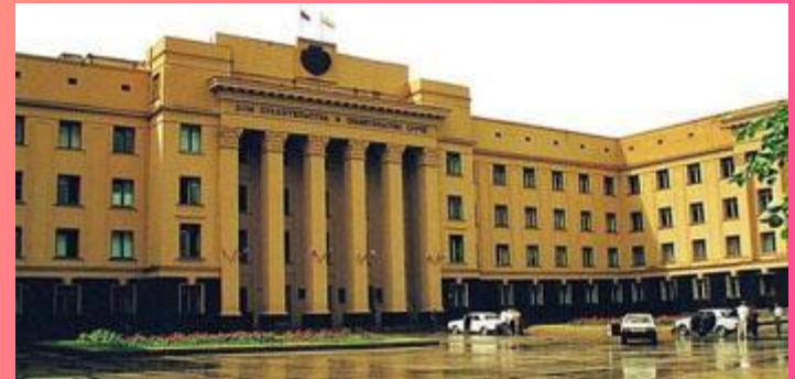
Чебоксары. Дом правительства