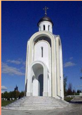
Часовня в парке Победы